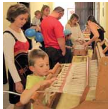
Jsmo na jednom z workshopů na ústeckém Větruši...

če po rodičovské dovolené, umožňují rodičům s malými dětmi pracovat z domova či poskytují jinou formu podpory na pracovišti rodičům s malými dětmi.