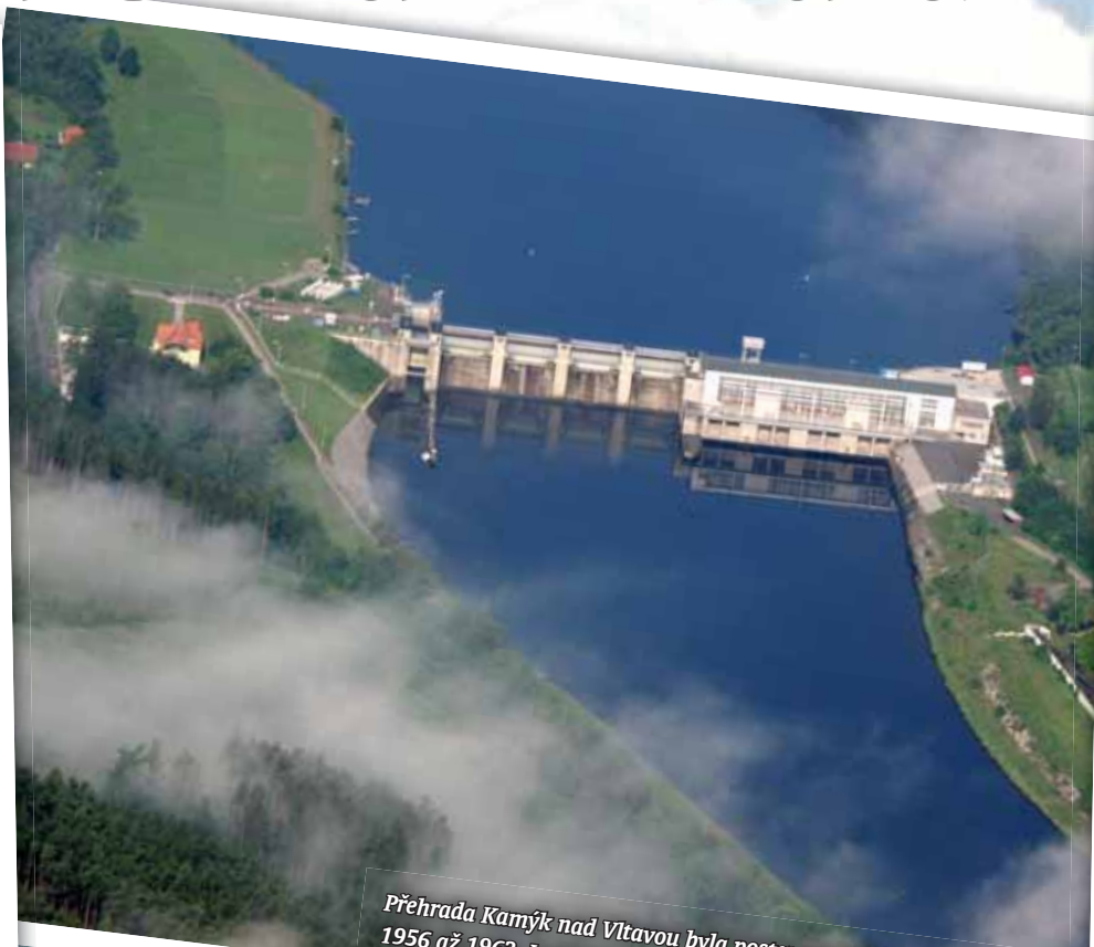
Přehrada Kamýk nad Vltavou byla postavena jako vyrovnávací nádrž v letech 1956 až 1963. Je vysoká 24,5 metru a v koruně dlouhá 174 metru.