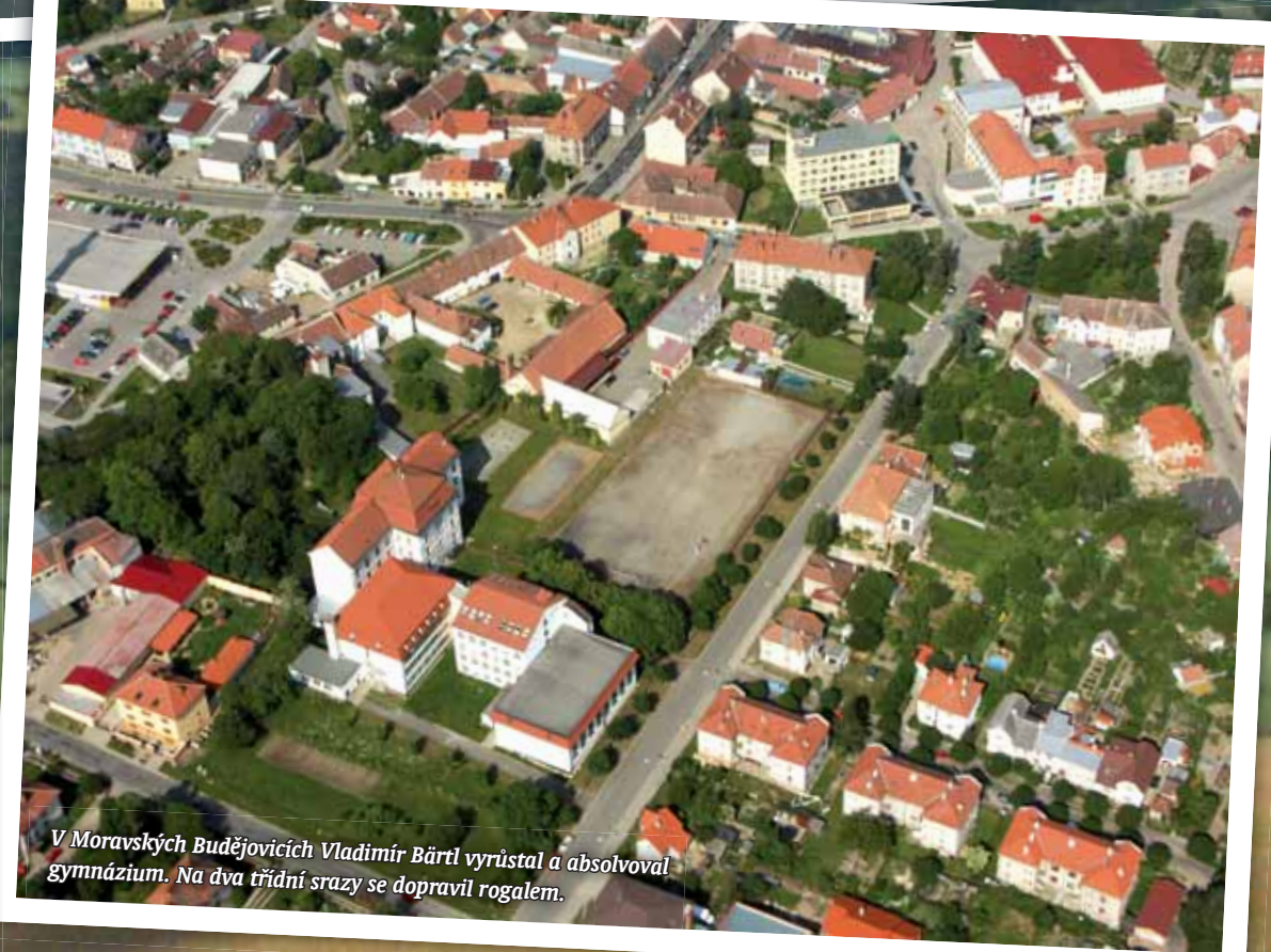
V Moravských Budějovicích Vladimír Bártl vyrůstal a absolvoval gymnázium. Na dva třídní srazy se dopravit rogallem.