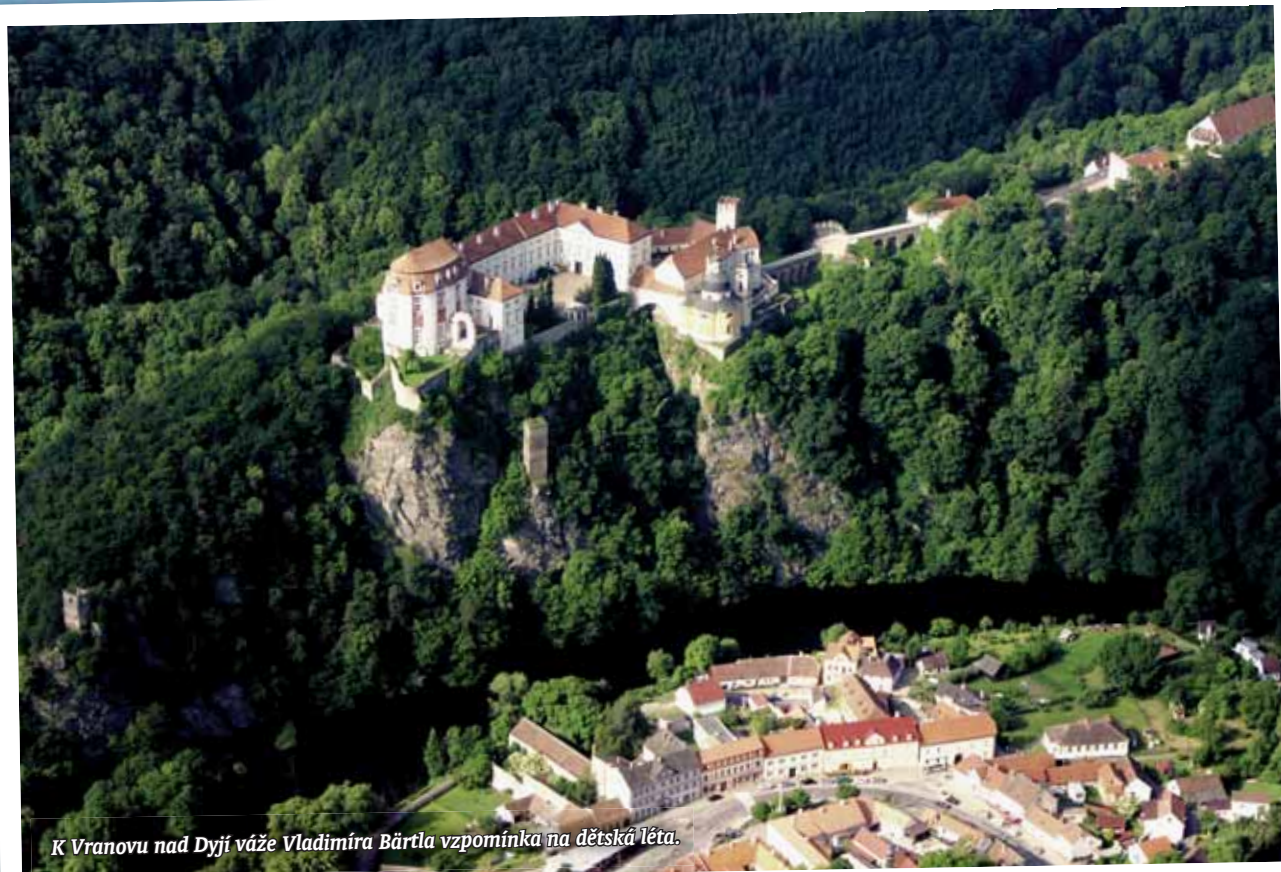
K Vranovu nad Dyjí váže Vladimír Bártl vzpomínka na dětská léta.

Poprvé jsem se svezl v Žatci s pilotem Pavlem Veselým. Přišerně jsem se bál, protože do té doby jsem byl zvyklý mít vedle sebe a pod sebou kabinu, a najednou jsem seděl „na štokdletě“ a kolem sebe nic... Začínal jsem v Teplicích, měl jsem tam i své sólo. Učil mě létat Vašek Pejřil, který mě doprovázel na zkoušky do Chotěšova u Plzně.