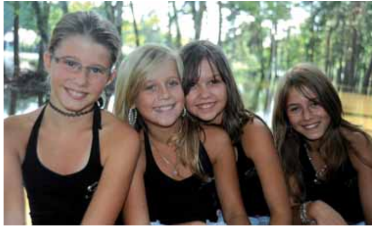
Taneční skupina Diamond cats.