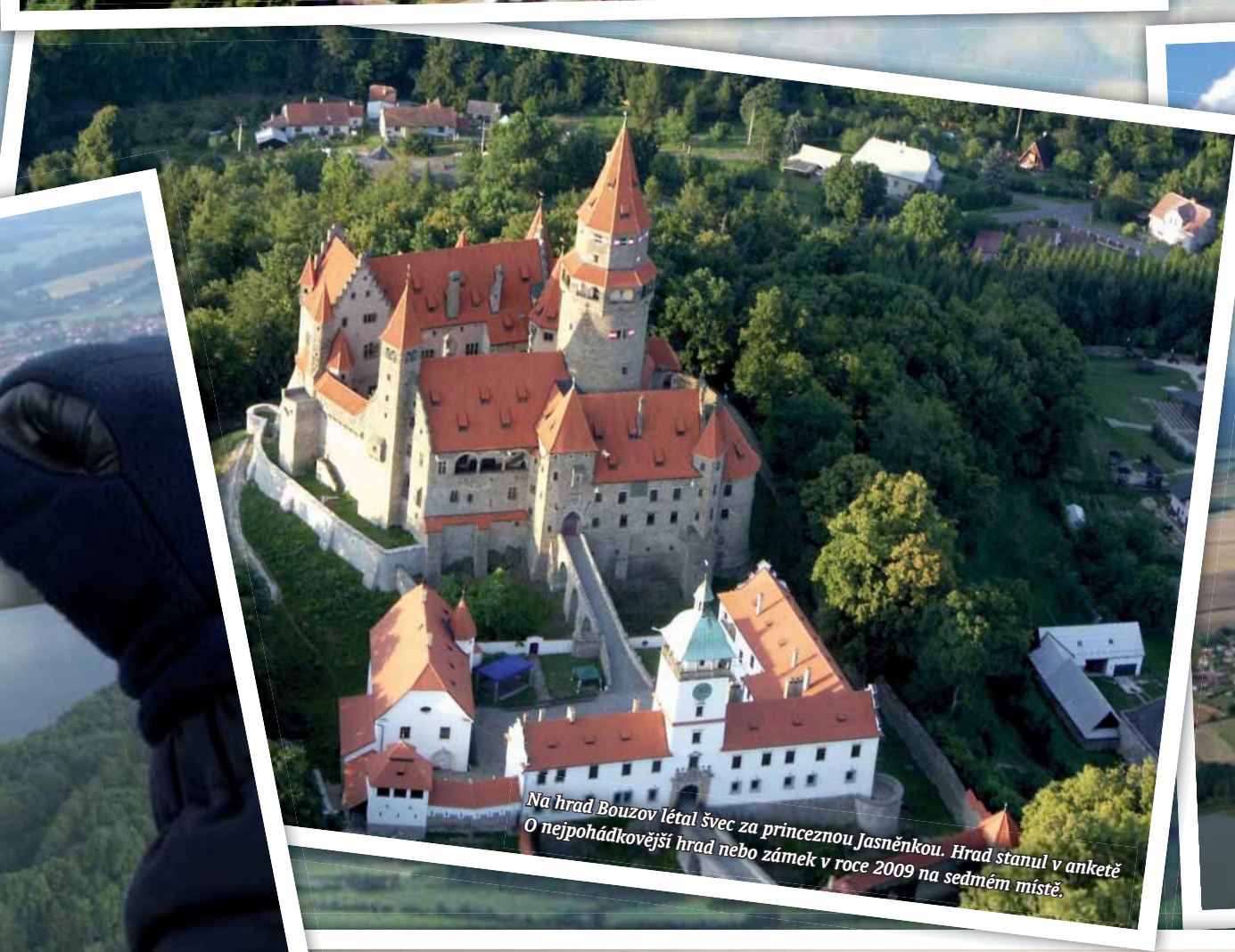
Na hrad Bouzov létal švec za princeznu Jasněnkou. Hrad stnul v anketě O nejpohádkovější hrad nebo zámek v roce 2009 na sedmém místě.