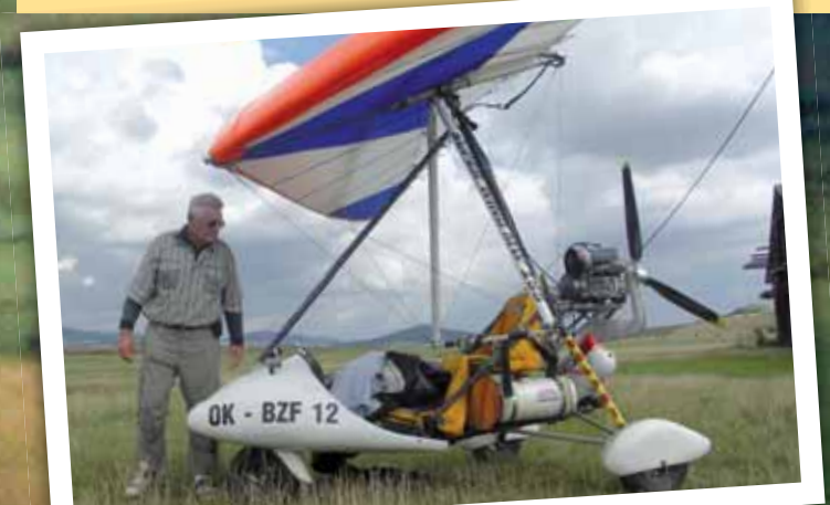
Připravili: Metropol, Jiří Vondráček, foto: Vladimír Bártl