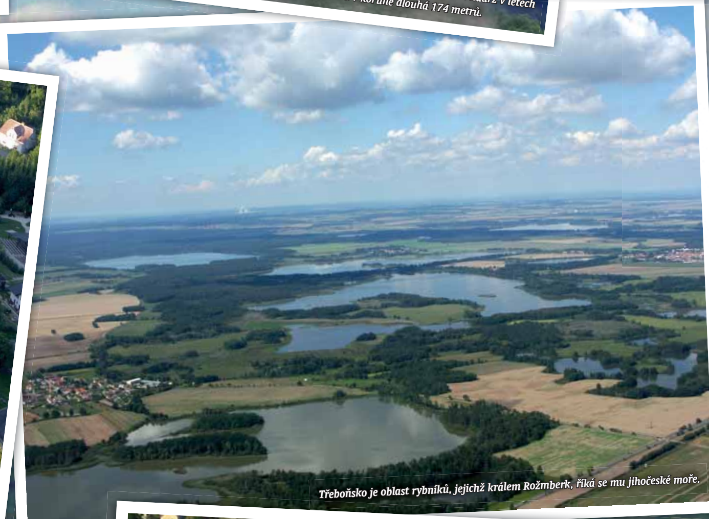
Třeboňsko je oblast rybníků, jejichž králem Rožmberk, říká se mu jihočeské moře.