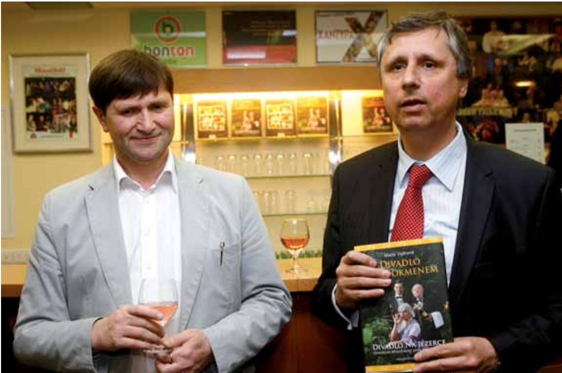
Na křest knihy přiletěl z Londýna i bývalý premiér České republiky Jan Fischer.