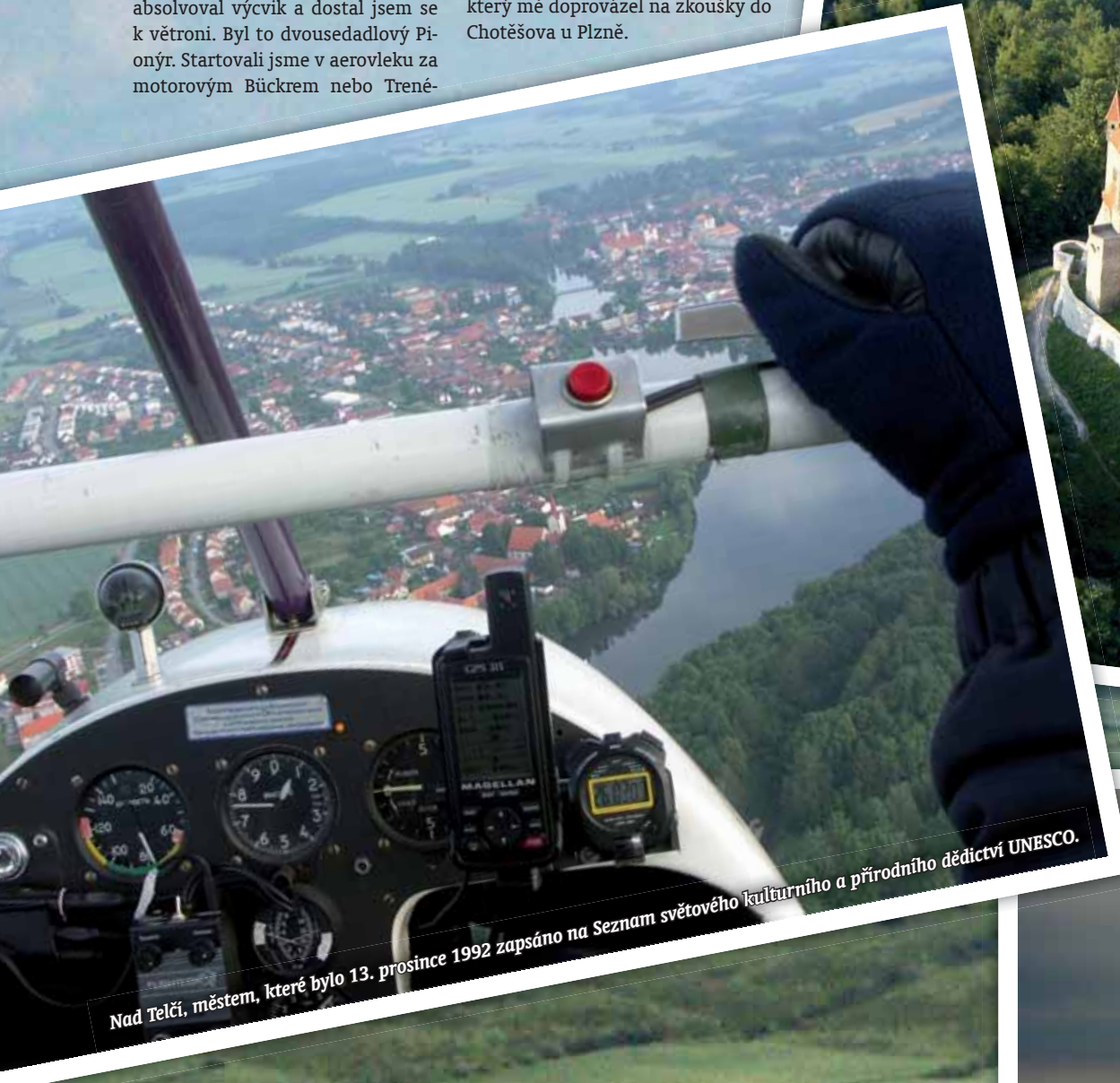
Nad Telč, městem, které bylo 13. prosince 1992 zapsáno na Seznam světového kulturního a přírodního dědictví UNESCO.