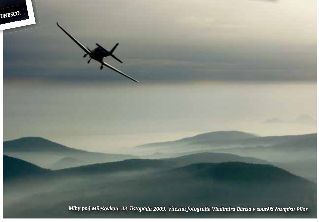
Mlhy pod Milešovkou, 22. listopadu 2009. Vítězná fotografie Vladimíra Bártla v soutěži časopisu Pilot.