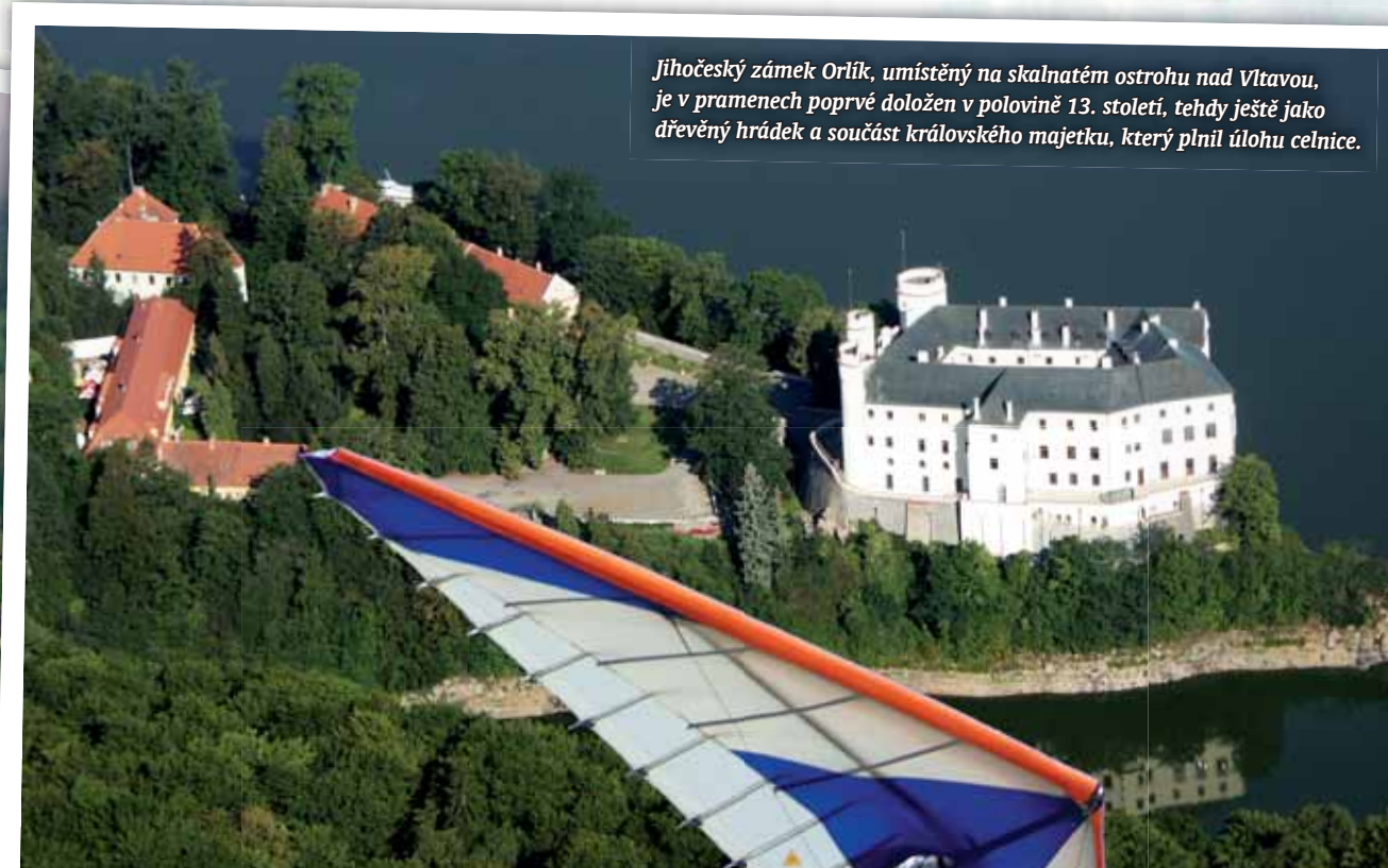
Jihočeský zámek Orlik, umístěný na skalnatém ostrohu nad Vltavou, je v pramenech poprvé doložen v polovině 13. století, tehdy ještě jako dřevěný hrádek a součást královského majetku, který plnil úlohu celnice.