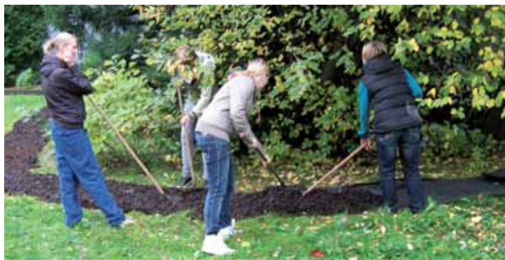
Zakládání naučné stezky v Žatci.

v září 2009 v německém Annabergu, kde mohli účastníci projektu nasbírat první nápady a vyměnit si zkušenosti s ostatními účastníky projektu. Do začátku byly firmy podpořeny startovním kapitálem ve výši 300 EUR. Za správné využívání těchto finančních prostředků zodpovídali vedoucí a účetní žákovských firem. K tomu, aby byly žákovské firmy udržitelné vzhledem k budoucnosti, byly žákovské firmy