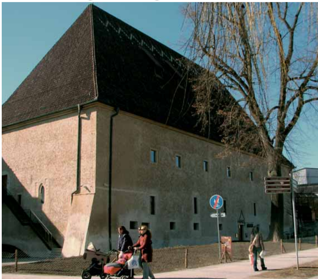
Gotický hrad je další dominantou Litoměřic.

Srdcem hradu je moderní expozice – zcela jistě turistická atrakce, a to nejen pro milovníky dobrého vína. Ta seznámí návštěvníky s dlouhou historií vinohradnictví v Čechách, když jedny z prvních vinic byly vysázeny právě v okolí Litoměřic. Umožní poznat vinařství z mnoha úhlů po-