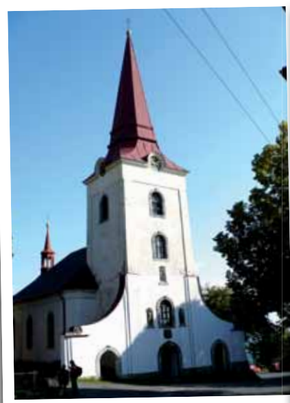
Kostel ve Světlé pod Ještědem.