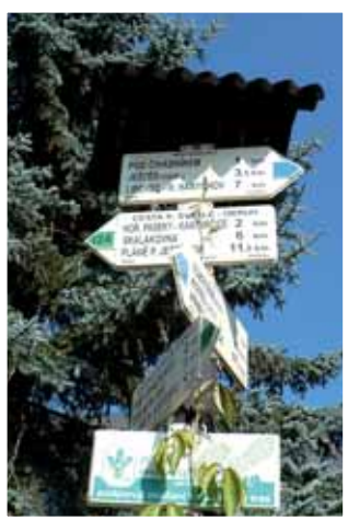
Rozcestník u kostela na počátku Cesty Karoliny Světlé.