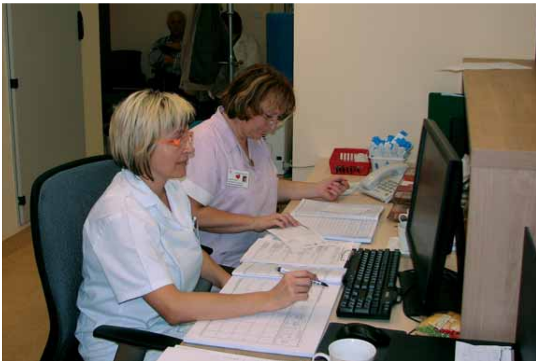
Péče o pacienty začíná už při příchodu na oddělení, kde je na recepci v komfortním prostředí o ně dobře postaráno.

Kardiocentrum KNL, a. s., má základy v roce 2003, kdy došlo k vyčlenění kardiologického oddělení z interního oddělení. V dalších letech se toto oddělení postupně rozrůstalo, přičemž získalo od ministerstva dvě významné akreditace jako kardiocentrum – první v roce 2007 pro vzdělávání mladých lékařů a v roce 2009 pro poskytování specializované péče. Dnes je jediným pracovištěm v kraji, které poskytuje tuto péči např. pacientům s ischemickou chorobou srdeční, srdečním selháním a poruchami srdečního rytmu, a to nejen obyvatelům Libereckého kraje, ale pacientům i v přilehlých regionech. „Jsem jediným pracovištěm v kraji, kte-