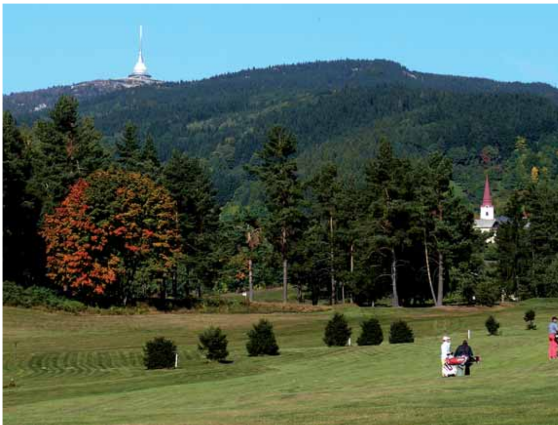
Podještědí se tulí k Ještědským horám.

dém ročním období, barvy podzimu však prožitek ještě více umocní. Vystoupit z autobusu u kostela nebo nechat auto na plácku u šenku Richtrů je nejlepším startem pro putování krajem. Mohutná lípa u cesty připomíná místo, kde spisovatelka sedávala a hovořila se Světelskými. Bělostná fasáda kostela svatého Mikuláše s věží zdobí obec už tři a půl století. Turistický rozcestník nabídne hned několik cest, zelená – po stopách románů Karoliny Světlé – je bezmála dvacetikilometrová a provází turistu nejkrásnějšími místy v okolí obce. Prudkým výstupem se lze dostat k původní české chalupě Na Pláních, kde bývalo letiště asi nejvýše položené v Čechách (780 m. n. m.), cvičiště alpských myslivců, skokanský můstek a lyžařské terény na počátku minulého století. Z místa kouzelných výhledů zavádí cesta okolo pomníčku připomínající setkání socialistů v roce 1870. Místo Nad Čihadníkem měla spisovatelka oblíbené pro jeho snadnější dosažitelnost a útulný koutek přírody. Na svahu Ještědského hřebene jsou dva lomy, dějiště povídky Karoliny Světlé Lamač, kde lze podnes nalézt polodrahokamy. V zorném poli se jako perličky objevují venkovské chalupy, dokumentující lidovou architekturu kraje bez továrních budov či rozsáhlých zemědělských objektů. Pohodová