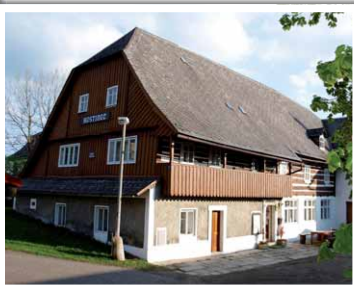
Hostinec, dějiště Vesnického románu, láká i dnes jako před sto padesáti léty.

cesta vede ke skalnímu obydlí, kde sebevraždou skončil svůj život frajer a vražedník Jáchym Skalák. Cesta se proplétá mezi domky a loukami téměř biblické krajiny, s místy označenými modrými cedulkami na domcích nebo samostatných objektech s památnými deskami. Jedno z nejzajímavějších míst je kříž, kde zrazená si Józ Potoc-