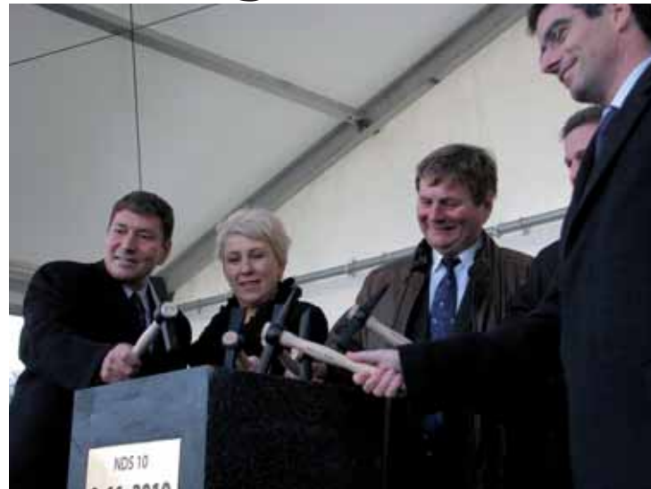
Slavnostního poklepu základního kamene se ujali vzácní hosté v čele s náměstkem ministra průmyslu a obchodu Ing. Tomášem Hünerem.

v roce 2003 rekonstruovaná neutralizační a dekontaminační stanice NDS 6. V roce 2005 byly vládou vyčleněny prostředky pro výstavbu dalších nezbytných technologií. První byla loni realizována a uvedena do zkušebního provozu technologie Zpracování matečných louhů, díky níž se mimo jiné zvýší roční množství vyváděných kontaminantů z 20 na 80 tisíc tun. Dnes zahajovaná výstavba NDS 10 uzavírá komplex technologií a výrazně pomůže ke zdárnému ukončení sanace v termínu do roku 2035. Tato technologie, v které se uplatňuje neutralizace a alkalizace zbytkových technologických roztoků vápenným mlékem s následným odstraňováním amoniaku vodní parou, umožní vyvést ročně až 30 tisíc tun kontaminantů, celkově pak budeme moci vyvézt až 100 tisíc tun ročně. Bez výstavby této stanice by se sanace protáhla o zhruba 70 let. Chtěl bych při této příležitosti vyslo-