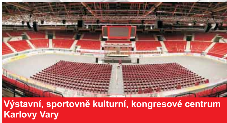
Výstavní, sportovní, kulturní, kongresové centrum Karlovy Vary