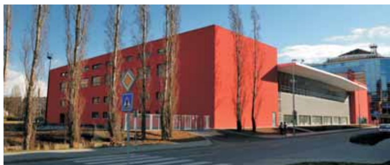
Atletická hala AC Sparta Praha