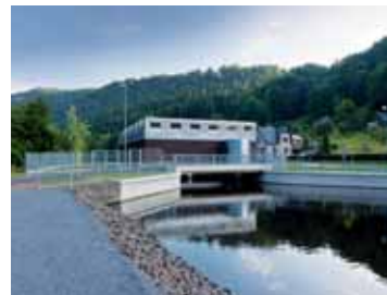
Vodní elektrárna v Železném Brodě.

Nominace za karlovarské sportovní kulturní centrum je pro SYNER v této kategorii staveb v pořadí druhým oceněním po liberecké Tipsport areně. Podobnost lze nalézt i v případě Kdyně, protože stejní stavaři mají za sebou úspěšné realizace v Děčíně, Berouně a dalších městech ČR. „Třetíčkou na dortu je nominace elektrárny, kterou získal jihlavský SYNER VHS, protože je to pro něj první stavba tohoto charakteru,“ říká Borovička. Stavaři liberecké společnosti si ocenění odborníků vážili i proto, že jejich konkurenty v získávání „stavebních oskarů“ jsou firmy, za nimiž ve většině případů stojí nadnárodní kapitál, zatímco SYNER je ryze česká společnost. SYNER, jež je součástí sdružení S group holding, vstupuje do 20. roku své existence. Za poslední stavební sezónu činil obrát SYNER 3 miliardy korun a jeho produktivita práce je nejvyšší mezi srovnatelnými velkými stavebními firmami ČR a blíží se k deseti miliónům na člověka. V porovnání s republikovým průměrem je to osmkrát více. (met)