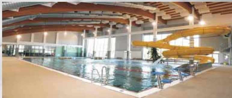
Centrum vodní zábavy Kdyně