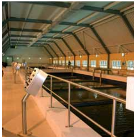
Rekonstrukce úpravy vody Souš a čistírny odpadních vod Liberec byly spolufinancovány z Fondu soudržnosti EU a SFŽP ČR. Obě stavby mají za sebou úspěšný roční zkušební provoz. Všechny sledované parametry odpovídají přísným evropským a českým normám.

Co se týče dotací z Fondu soudržnosti, tam je situace již dořešena. Při přijímání dotace z Fondu soudržnosti na projekt Lužická Nisa se SVS zavázala splnit podmínku uzavření smlouvy s provozovatelem podle nejlepší mezinárodní praxe. K dohodě vedla složitá vyjednávání obou společností, SVS a SČVK. Dodatek provozní smlouvy připravovaný expertními týmy práv-