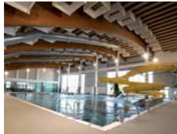
Centrum vodní zábavy, Kdyně. Interiér a exteriér.