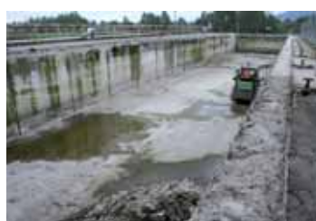
Rekonstrukce ČOV Stráž pod Ralskem zahájena v září 2010 je jednou z posledních strategických investic v oblasti čištění odpadních vod v regionu působnosti SVS. Stavba měla být zahájena v srpnu, to byl ale areál ČOV pod vodou rozlité Ploučnice.

vaně několik let za sebou hospodaří se ziskem, který se souhlasem akcionářů celý vkládá do fondu reinvestic. Dlouhodobě vážnoucí dotace z OPŽP již ale vedou i k alternativním způsobům financování staveb, jako jsou úvěry a půjčky. S využitím úvěrů SVS realizovala nedávno dokončenou rekonstrukci ČOV Varnsdorf v objemu přes 200 milionů korun.