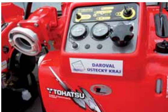
Jedna z pěti nových stříkaček zn. Tohatsu pro jednotky sborů dobrovolných hasičů.

Jednotky sborů dobrovolných hasičů z ústeckého obvodu Neštěmice a z obcí Klapý, Lubenec, Černovice a Hora