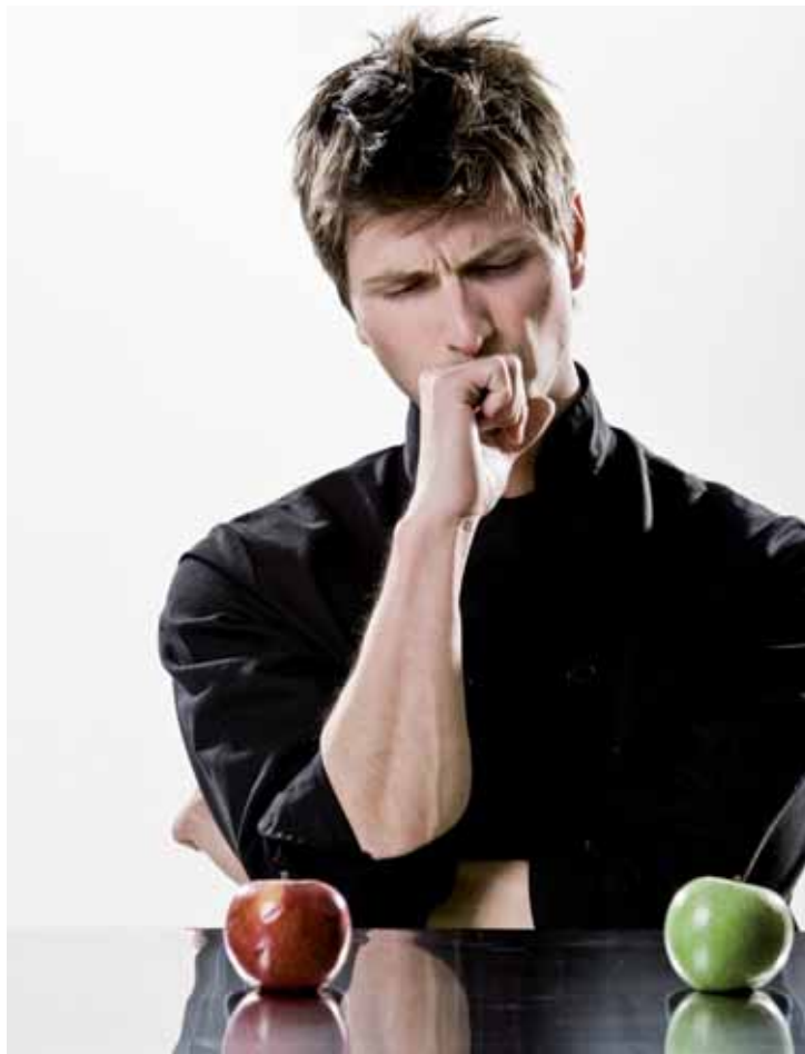
Pro očistu těla je možno absolvovat detoxikační dietu.

Pro očistu těla je možno absolvovat detoxikační dietu, pít vody, ovocných a zeleninových šťáv, bylinných čajů, travinových doplňků, očistu střeva (klystýry, hydrocolon terapie) a v neposlední řadě rozumnou tělesnou aktivitu. Během detoxikačního týdne se zřekneme stimulantů jako je kofein, alkohol, nikotin, cukr, aby mělo tělo dostatek klidu a energie pro vnitřní očistu. Velký úklid trvající po dobu jednoho týdne