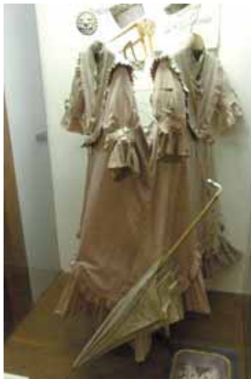
... a jejich vystavené šaty

vého barokního trziště, model bývalého milevského kostela sv. Bartoloměje, cechovní praporec a památky na hrdelní soudnictví na Milevsku. Ale například i náčiní a zbraně používané za 1. světové války. Jsou zde však také památky na doby první republiky a na nacistickou okupaci. Schodiště muzea zdobí dokumentární fotografie staré Vltavy a také významných rodáků z Milevska a okolí.