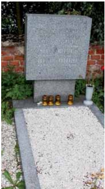
Herečka Karolíně Slunéčkové by bylo 76 let. Zemřela před 27 lety a pochována je na hřbitově ve Lnářích.

Už od dívčích let se věnovala baletu, ale ovládala výborně i step a další taneční techniky. Podle rodiny, přátel i kolegů byla Karolína doslova neutuchajícím gejzírem energie. „Klidně přijela po celotýdenním natáčení sem na chalupu a začala se vrtat v záhonku, nebo opravovala střechu, nebo něco natírala. Mezitím si zapálila a povídala si s návštěvami. Vařila, vyprávěla, učila se texty. Prostě, byla