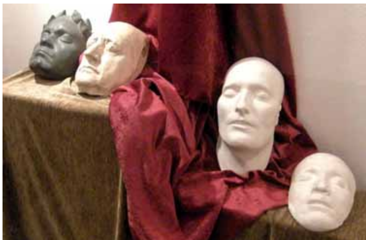
Ludwig van Beethoven, Johan Wolfgang Goethe, Napoleon Bonaparte a Alexandr Puškin

V prosklených vitrinách na chodbě muzea tak lze mezi 26 exponáty najít posmrtné podobizny například prezidentů T. G. Masaryka, Edvarda Beneše, hudebního skladatele Antonína Dvořáka, spisovatele Karla Čapka, F. L. Čelakovského, básníka Jiřího Wolкера, pěvkyni Emmu Destinovou, či třeba Milana Rastislava Štefánika. Ke zhlédnutí je ale i maska Napoleona Bonaparte, nebo hudebních velikánů Ludwiga van Beethovena a Johana Wolfganga Goethe „Vybrat z historických významných osobností nebylo vůbec jednoduché, především proto, že jsme byli limitováni počtem exponátů. Zároveň z pietního hlediska bylo možno umístit do jed-