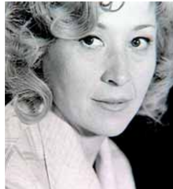
nec zemřela. Až po její smrti se našel její ručně psaný deník, který její obecně vnímaný optimistický obraz

V době své největší slávy bohužel onemocněla rakovinou plic a nako-