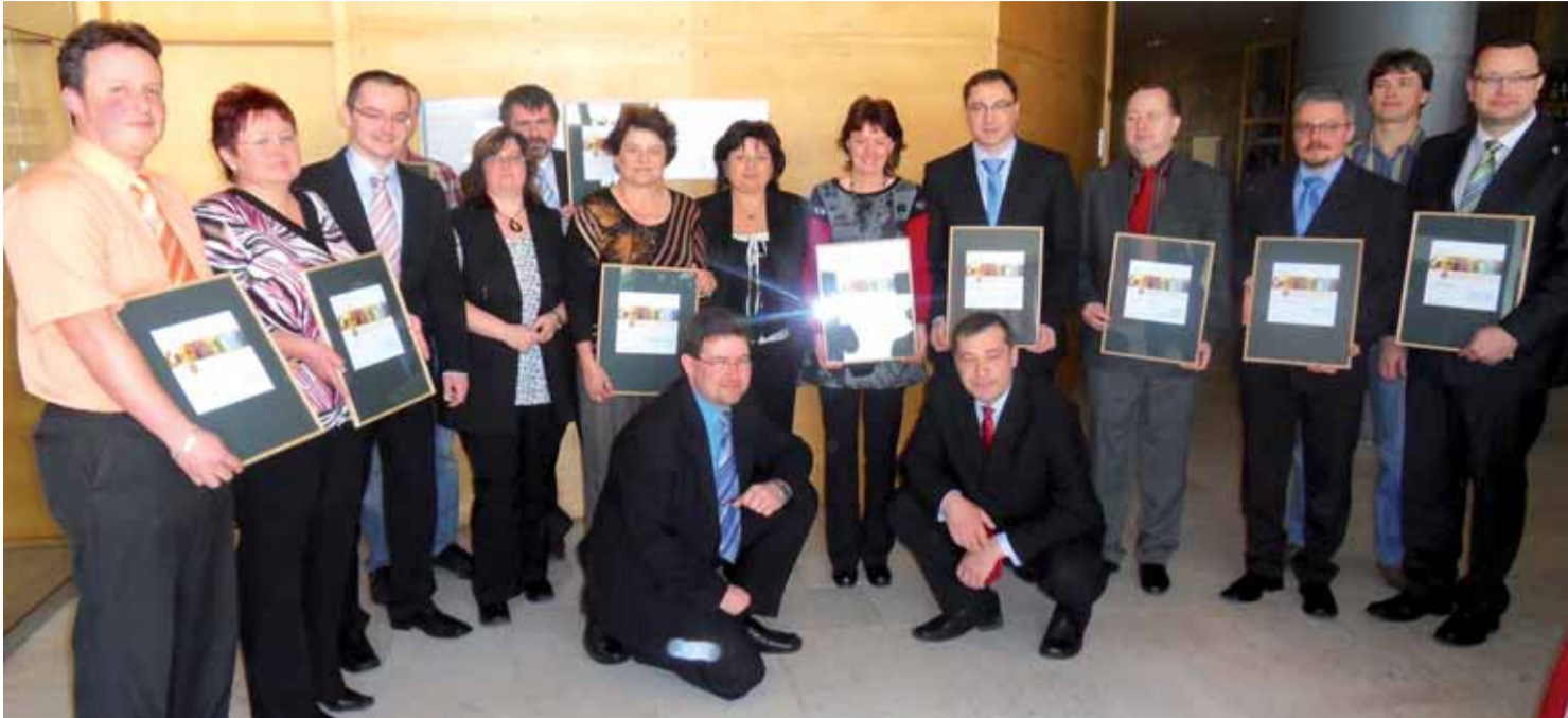
Představitelé měst a obcí, které se umístily na prvních třech místech v jednotlivých kategoriích soutěže Zlatý erb.

Ústecký kraj | Na slavnostním ceremoniálu byly 11. března za účasti hejtmanky Jany Vaňhové vyhlášeny výsledky krajského kola Ústeckého kraje soutěže Zlatý erb. Města a obce v ní soutěžily o nejlepší webové stránky.