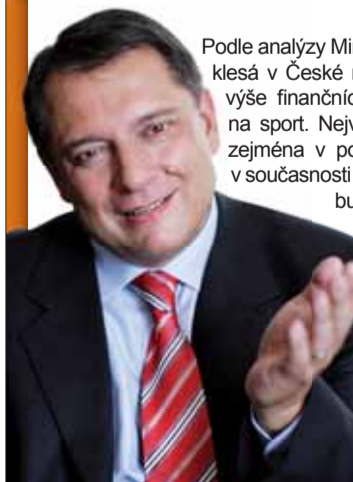
Jiří PAROUBEK předseda ČSSD

Český sport prochází krizí. Je to vidět i na výsledcích z olympiády či na různých mezinárodních soutěžích. Jaké jsou důvody?