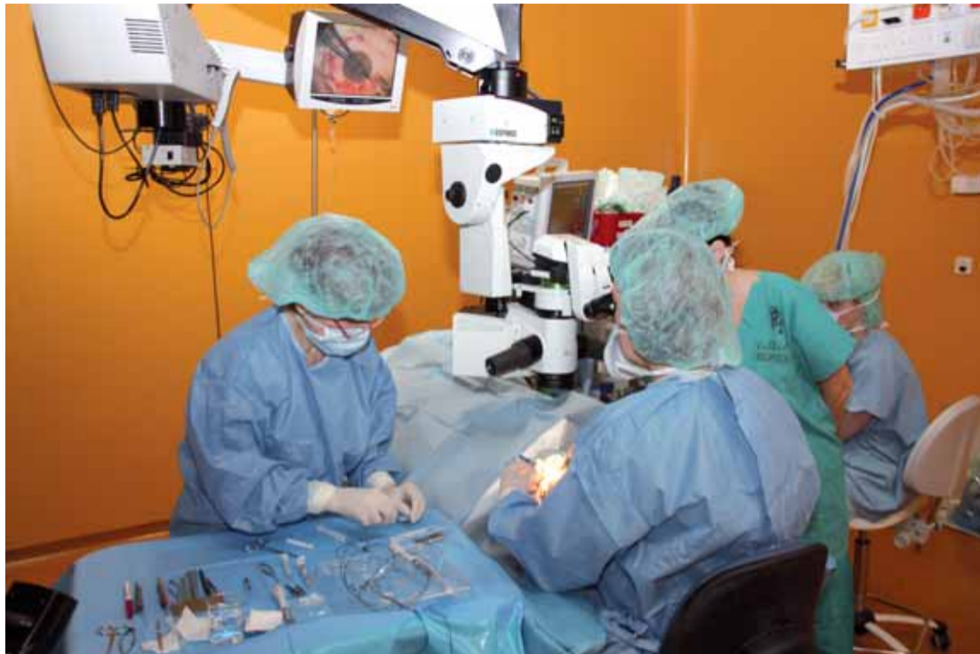
Tým lékařů očního oddělení ústecké Masarykovy nemocnice provedl operaci pokročilého stadia glaukomu metodou zvanou kanalooplastika.

Ústí nad Labem | Unikátní operaci pokročilého stadia glaukomu (zeleného zákalu), metodou zvanou kanalooplastika, provedli lékaři očního oddělení Krajské zdravotní, a. s. - Masarykovy nemocnice v Ústí nad Labem, o.z.