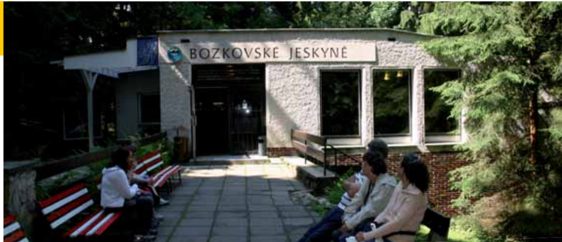
Vchod do Bozkovských jeskyní

Novodobí poutníci však častěji navštěvují Bozkovské dolomitové jeskyně nedaleko podkrkonošské vesnice. Není tomu tak dávno, kdy podzemní katedrála přivítala první návštěvníky. První nálezy krásných krápníkových komnat patří dělníkům, kteří odstřelili skálu v malém lomu na Vápenici v roce 1947. Dvacet let trvaly práce na odhalení celého systému podzemí a veřejnost má do jeskyní přístup od roku 1969. Již od rána sem každodenně přijíždí po celý rok návštěvníci a protože vstup je umožněn pouze skupinám o omezeném počtu osob, nikdy se nedá vyhnout frontám. Objevitelé nazvali jednotlivá místa podle svých představ Loupežnickou, Pohádkovou jeskyní, Blátivou chod-