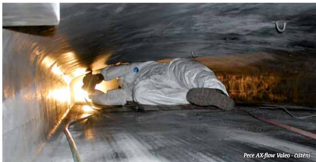
Pece AX-flow Valeo - čištění

Nejde jenom o záchranu lidských životů, ale i o provádění činností vedoucích k odvrácení nebezpečí spojené s ohrožením zdraví osob nebo vznikem majetkových škod, případně škod na životním prostředí. Naše pomoc je komplexní, při akcích integrovaného záchranného systému spolupracujeme s hasiči a zdravotními záchrannými. Mezi zásahy patří i tzv. plánované zásahy. Jak již z názvu vyplývá, jde o naplánované práce prováděné většinou v nedýchatelném prostředí v náročných báňských podmínkách.