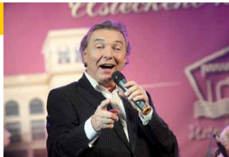
Největší hvězdou mezi vystupujícími umělci byl Karel Gott.