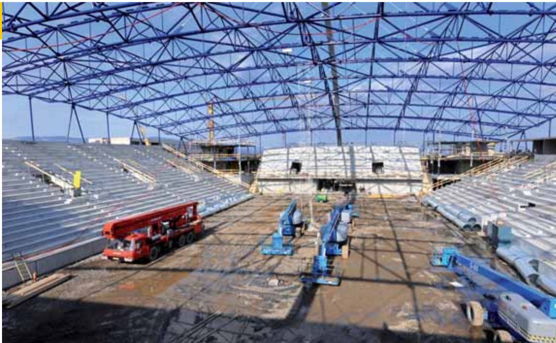
Nový zimní stadion v Chomutově zajistí potřebný komfort hokejistům a jejich fanouškům.

cí stadion sloužil přes půl století a teď už nevyhovuje soudobým požadavkům.