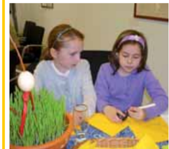
Z loňských bruselských, ale českých Velikonoc...

V sobotu 20. března se tam konala výstava velikonočních kraslic a starožitných forem na pečení, řehtaček či klapáček z Ústecka a návštěvníkům přiblížili pořadatelé i velikonoční tradice, jakými jsou malování kraslic a pletení pomlázek. V Bruselu byly také prezentovány turistické destinace Ústeckého kraje, a to prostřednictvím lidové architektury, tradičních a populárních jarmarků a festivalů lidové tvorby. (krz)