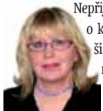
Přípravila: Ludmila Petříková