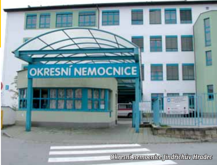
Okresní nemocnice Jindřichův Hradec

Jihočeský kraj, jakožto zřizovatel zdravotnických zařízení, se bude na financování projektů finančně podílet zhruba deseti procenty. Příslušné dotace z operačního programu