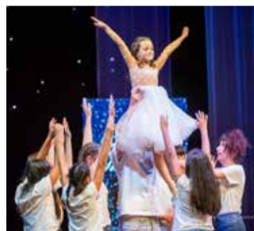
Slavnostního večera v Městském divadle v Mostě se tradičně zúčastnily i obdarované děti.