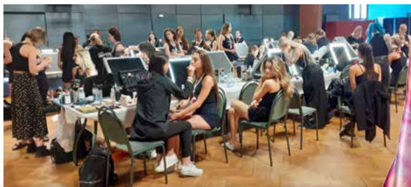
V zákulisí pilně pracovaly kadeřiče, vizážistky i oblékačky. Mezi přehlídkami nebylo mnoho času.