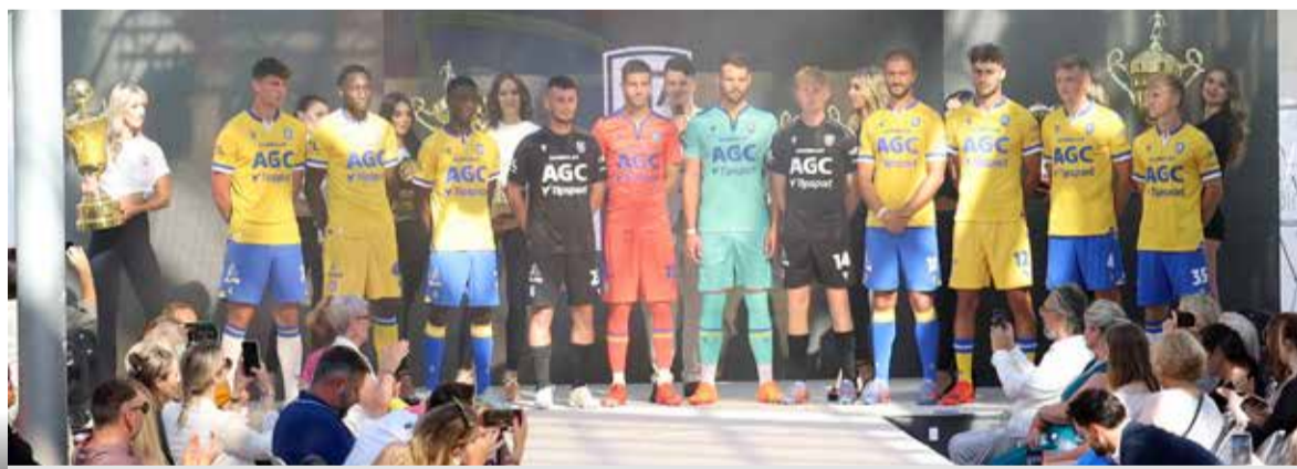
Fotbalisté FK Teplice v nových dresech. Ať se jim daří!