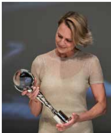
Americká herečka Robin Wright

Cenu prezidenta převzala americká herečka Robin Wright. „Tato cena je speciální, protože není jen za jeden konkrétní výkon. V duchu jsem si to spočítala – a těch herečkových čtyřicet let mi uteklo jako čtyři roky. Mít takovou práci a milovat ji, je vzácná věc,“ zamyslela se v děkovné řeči filmová Princezna Nevěsta, láska Forresta Gumpa nebo chladná paní Underwoodová ze série Domek z karet. „Děkuji celému festivalovému týmu – je to jeden z nejlepších festivalů, kde jsem kdy byla. Díky, že podporujete film.“ Herečka poté vyjádřila vděk divákům i přání, aby se návštěvnost kin vrátila do let před celosvětovou covidovou epidemií. Laureátkou Ceny prezidenta se stala také Daniela Kolářová. „V Karlových Varech jsem žila od čtyř do osmnácti let a mám odsud mnoho vzpomínek. Řeknu jen, že jsem ráda, že se hotel Pupp opět jmenuje Pupp. My jsme absolvovali taneční v hotelu Moskva,“