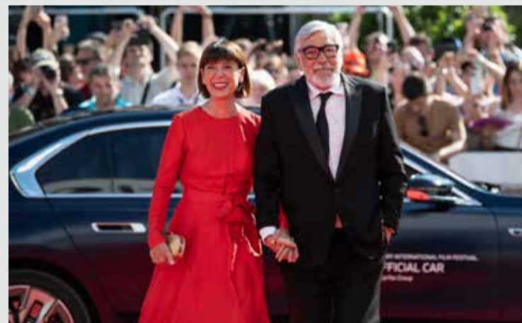
Také letos přijžděli pořadatelé i hosté k červenému koberci vozy značky BMW.

Režisér ji zmínil i ve své děkovné řeči: „Chtěl bych cenu věnovat generaci mých rodičů - to oni jsou hlavními hrdiny našeho filmu. Stali se obětí tržního hospodářství v Bulharsku a často kvůli němu o mnoho přišli. Také děkuji svým kolegům a neuvěřitelné Eli.“