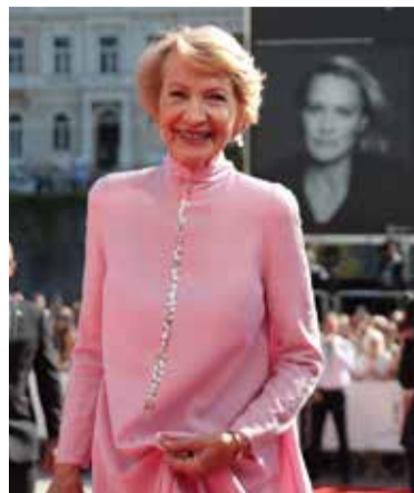
Oblíbená česká herečka Daniela Kolářová.

glosovala jedna z nejobsazovanějších českých hereček. Hvězda filmů Vratné lahve, Léto s kovbojem nebo na KVIFF uvedené komedie Kulový blesk pokračovala vzpomínkami na normalizaci. „Byla obnovená cenzura, celá politická reprezentace respektovala okupační vojska. V těchto příšerných poměrech jsem měla neuvěřitelné štěstí na své herečké kolegy. Potkala jsem se s inteligentními a slušnými lidmi a jsem ráda, že je můžu potkávat do