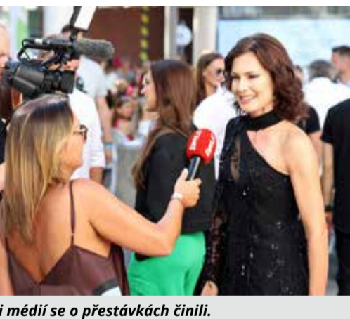
i médií se o přestávkách činili.