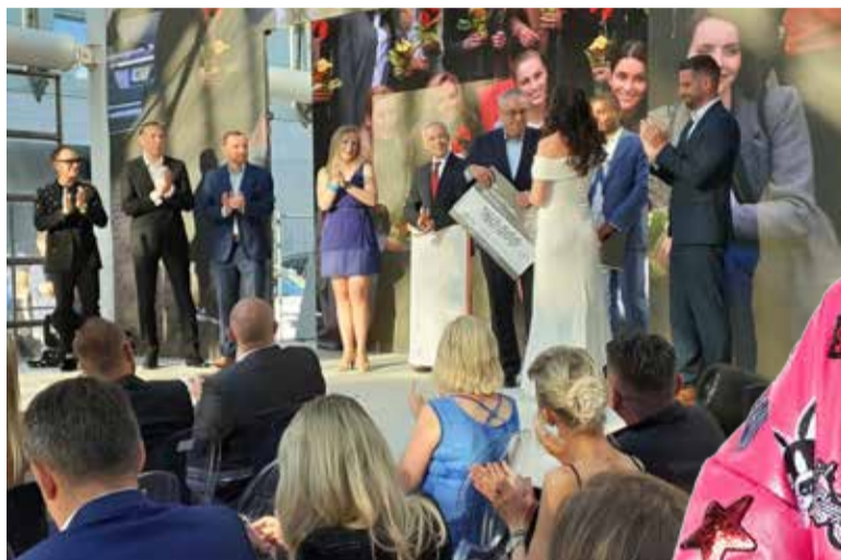
Předávání šeků pro teplickou nemocnici.