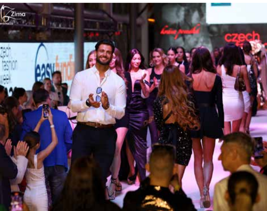
né defilé všech účastníků si vysloužilo divácké ovace vestoje.