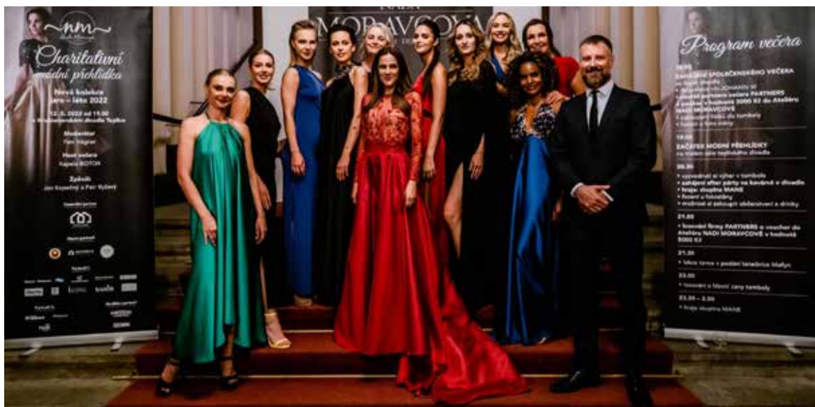
Společná fotografie z poslední nádherné přehlídky společenských šatů.