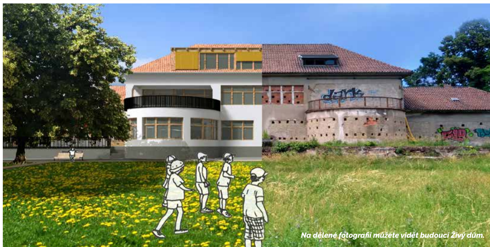
Na dělené fotografii můžete vidět budoucí Živý dům.

Myšlenka to není nová, jak mi v rozhovoru potvrdily ředitelka Salesiánského střediska Štěpána Trochty v Teplících Vendulka Drobná a fundraiser Hana Machová. Obě mají s prací s dětmi a mládeží i s celými rodinami z rizikového prostředí bohaté zkušenosti. Střediska mají v Proseticích, kde je i multikulturní základní škola, a v Trnovanech. V teplickém okrese vstupují i do základních škol s preventivními programy proti šikaně. Ročně jejich rukama projde na 1 500 dětí a mladých lidí, některé tak nebloudí po obchodních centrech nebo na ulicích a nenudí se. Touha po uznání v partě je často vede k činům, které společnost odsuzuje. Doma nemají dostatek pozornosti ani pevně stanovené hranice, kam až mohou zajít. Proto bojují o své místo na světě šikanou, vandalismem, krádežemi, závislostmi. Salesiáni jim i jejich rodičům dávají šanci, jak žít jinak.