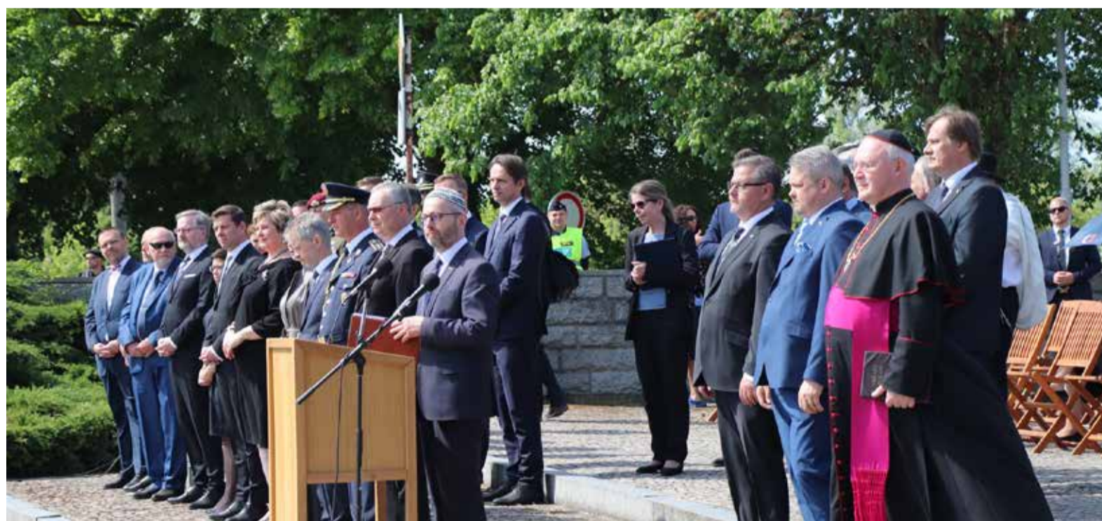
Účastníci Terezínské tryzny

V neděli 15. května se na Národním hřbitově před Malou pevností konala tradiční Terezínská tryzna. Vzpomínkovou akci organizoval Památník Terezín ve spolupráci s Ústeckým krajem, městem Terezín, Federací židovských obcí v ČR a Terezínskou iniciativou. Záštitu nad konáním Terezínské tryzny 2022 převzal ministr kultury Martin Baxa.