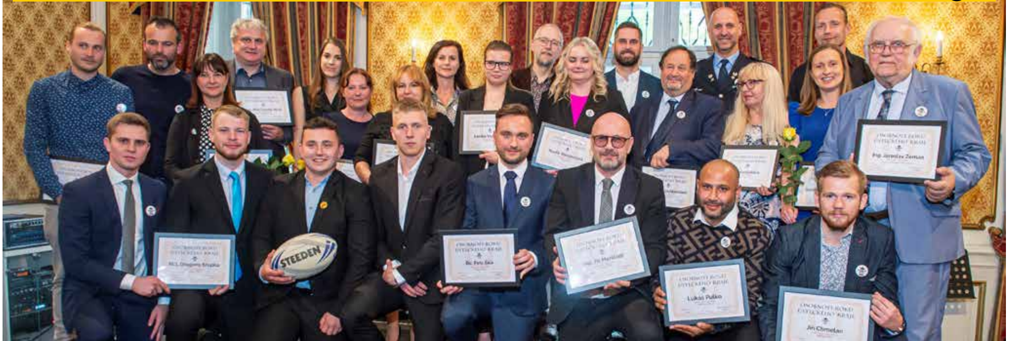
To jsou ony - Osobnosti roku 2021 Ústeckého kraje. Blahopřejeme!

Ve čtvrtek 5. května byly v Zahradním domě v Teplicích dekorovány osobnosti roku 2021 Ústeckého kraje. Vybrali je čtenáři v elektronickém hlasování oblíbené ankety.