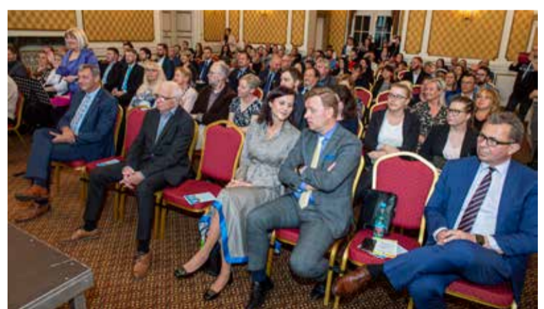
Pohled do publika, které tvořili partneři ankety, blízcí a přátelé oceněných.