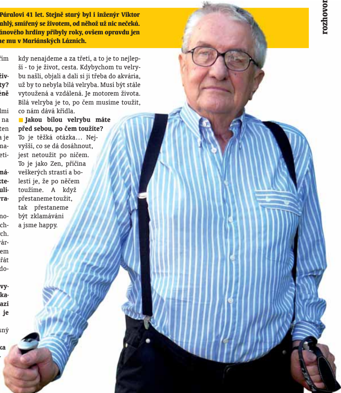
Text a foto: Alena Volfová

To je jako Zen, příčina veškerých strastí a bolestí je, že po něčem toužíme. A když přestaneme toužit, tak přestaneme být zklamáváni a jsme happy.