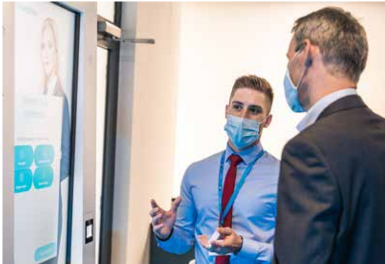
Jak funguje elektronická recepční.

Nové služby inovačního centra je možné si prohlédnout na webu space.icuk.cz