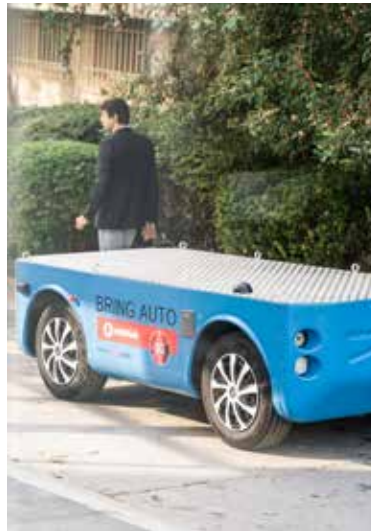
Telemetricky ovládané elektrické vozítko.