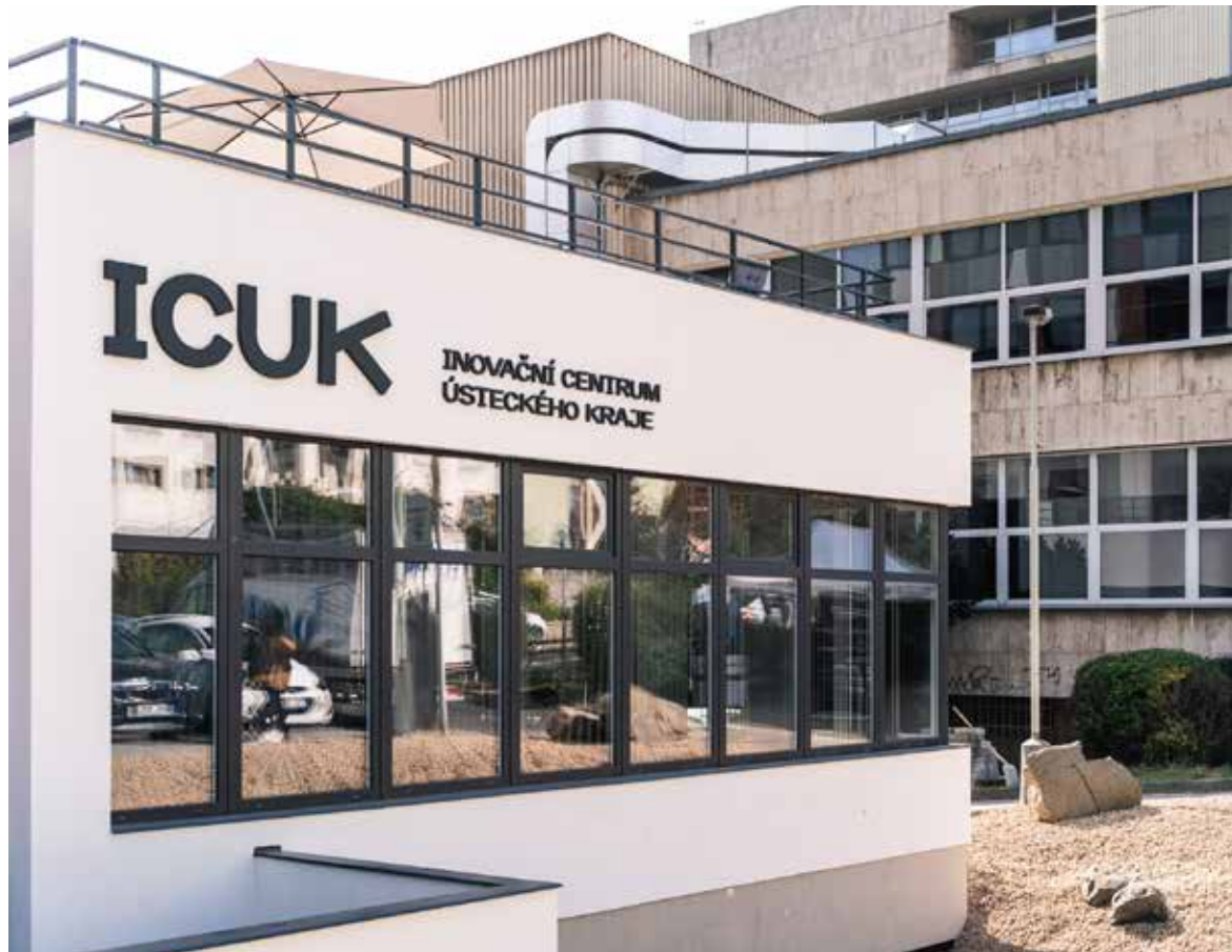
Nové prostory najdete ve Velké Hradební ulici 2800 v Ústí nad Labem.

Na novém místě nebude ICUK sám. Jeho služby doplní organizace, které se podporou obchodu, podnikání a inovací zabývají také. Společně s ICUK se na stejnou adresu stěhují rovněž agentura CzechInvest, Agentura pro podnikání a inovace, regionální zastoupení Technologické agentury ČR a organizace CzechTrade. „Smyslem bylo shrnout služby podobného ražení pod jednu střechu, vytvořit takový inovačně-podnikatelský czechpoint, který podnikatelům umožní vyřídit vše najednou a získat komplexní služby. Spolu s profesionálním jednáním a expertizou to bereme jako nový prototyp krajských služeb, jak je