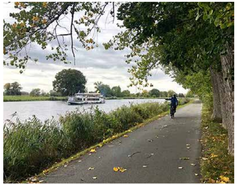
Labská stezka nabízí krásné svezení i v podzimním období

toval více než 400 milionů korun, jednotlivé úseky byly spolufinancovány dotací z ROP Severozápad, IROP a SFDI. Ekonomický přínos cyklostezky pro region byl na základě loňského šetření spočítán na cca 60 milionů korun za sezónu, přičemž má stále potenciál růstu. Měření průchodů na stezce ukázala, že i v jarních měsících, kdy se život skoro zastavil, byla návštěvnost Labské stezky stálá, a na některých místech dokonce stoprocentně narostla. To je důkazem, že v současné době se právě cykloturistika může stát motorem místního cestovního ruchu. Máte-li chuť, zveme vás na cyklovýlet.