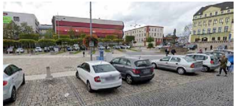
Pohled na telekomunikační budovu na náměstí Svobody.