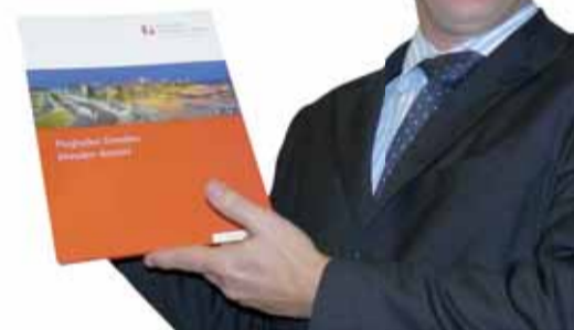
Text a foto: Alena Volfová

Na příští rok, 18. a 19. září, letiště chystá u příležitosti svého 75. výročí pátou velkou slavnost a letištní noc. Po akci Funk & Soul Night posledního října je plánovaný tradiční přelet Santa Clause 24. prosince, oblíbený zejména mezi dětmi.