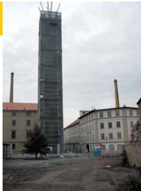
První etapa projektu Chrám Chmele a Piva odhalila historickou část Pražského předměstí, na kterém je dominantou Chmelový maják.

Do konce roku 2010 se očekává ukončení 3. etapy, která zahrnuje zázemí pro nejmenší návštěvníky - Jižní zahradu s ce-