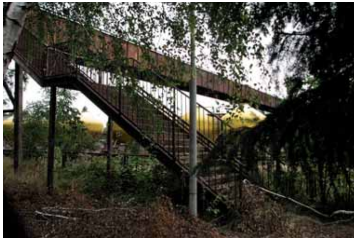
Současný stav lávky přes železniční trať.

Firma se i přes hospodářskou recesi snaží zachovat pracovní místa, v současné době zaměstnává na 400 pracovníků, pro které jsou vytvářeny velmi dobré sociální podmínky. O to víc