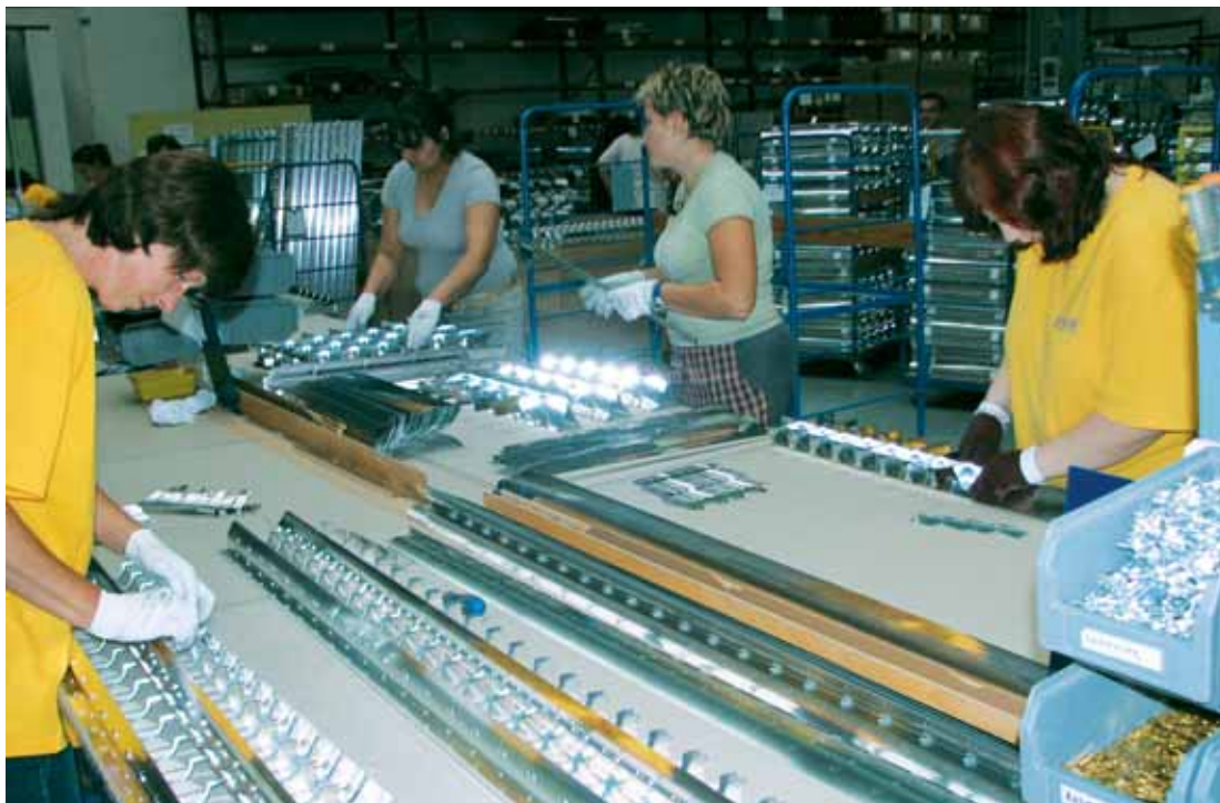
Pracovnice montáže při kompletaci svítidel.

mrzí management, že po tolika letech se v tamní průmyslové zóně, kde sídlí přes deset firem, nepodařilo realizovat žádné zlepšení. Přístupové komunikace jsou v nevyhovujícím stavu, okolí je zarostlé plevelem a náletovými dřevinami. Nejhorší je však dostupnost lidí do