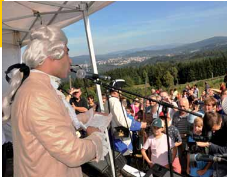
Josef II. (Petr Jeništa) promlouvá k účastníkům slavnostního otevření rozhledny.