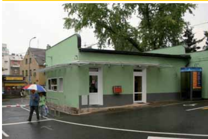
Vrátnice a bufeta „Na Husovce“ prošly rekonstrukcí.

Liberec | Krajské nemocnici Liberec, a. s., se díky promyšlenému hospodaření a dobrým ekonomickým výsledkům daří realizovat nejen náročné rekonstrukční akce a stavební úpravy zvelebující technicky i dispozičně zázemí jednotlivých oddělení, ale také vylepšuje exteriérové části areálu.