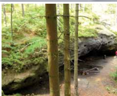
Často navštěvovanou jeskyní je Jermanová skála, opředená spoustou příběhů.

Příkrý hřbet neoplyvá přílišným množstvím vody, četné potůčky z vrcholku odvedou vodu do dvou moří, Baltského a Severního, aniž by zanechaly alespoň pár kapek v rybnících či jezírkách. V podzemí není jezero, jak se občas tvrdí, o to jsou bystriny divočejší a studánky pohádkovější.