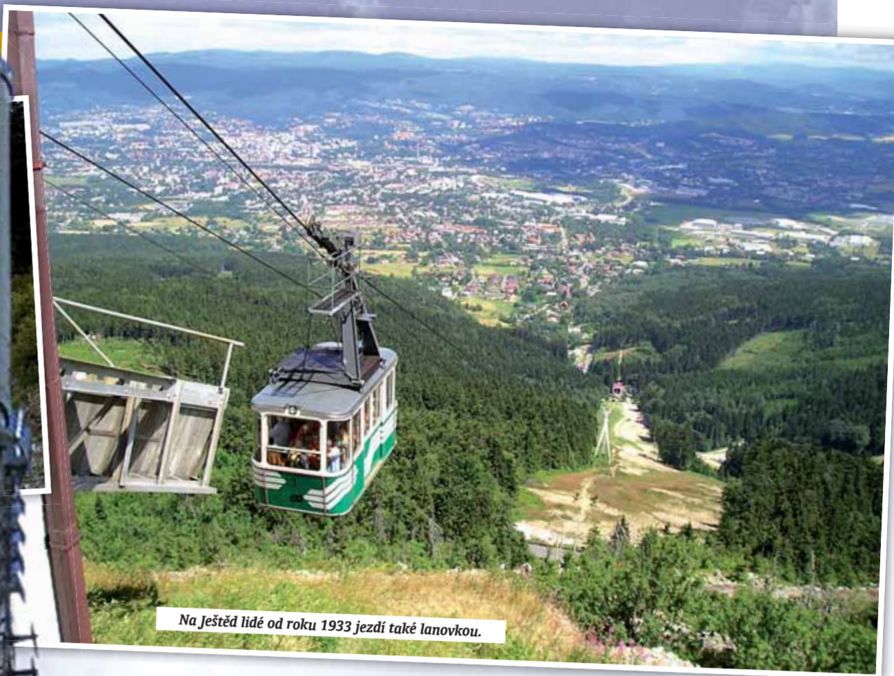
Na Ještěd lidé od roku 1933 jezdí také lanovkou.