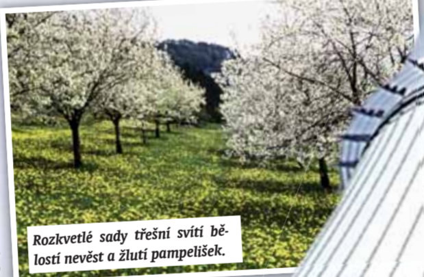
Rozkvetlé sady třešní svítí bělostí nevěst a žlutí pampelišek.

ty, jen zajíců je pomálu. Nejrozšířenějším živým tvorem jsou v jeskyních netopýři a mezi kameny zmije, slepýši. Lidé pak kraj doplnili stády ovcí, vepřů, krav, domácí havěti a chovem uslechtilých koní.