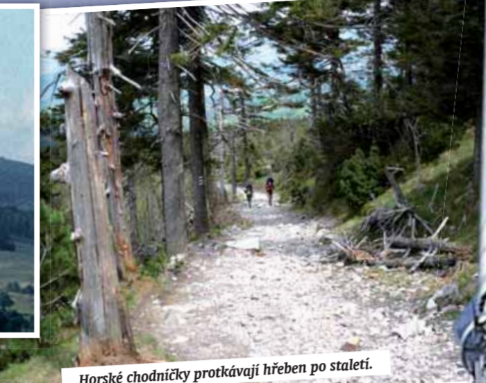
Horské chodníčky protkávají hřeben po staletí.

srážek charakterizují celé pohoří. Zdobné kleče sem našly cestu až v devatenáctém století a ani smrků tady nemají svou pravlast. Většina hor byla buď holá či zalesněná listnatými stromy, křovisky. Na severní straně najdeme skvost karlovošských bučin. Březové hájky a borovice dotvářejí lesní ráz. Zjara pak rozsvítí stráně květy třešní, jabloň a švestek. Podzim ozdobí jeřabinami žlutnoucí barvu zelené stromů.