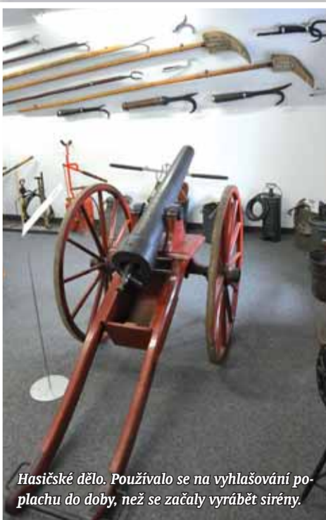
Hasičské dělo. Používalo se na vyhledávání poplachů do doby, než se začaly vyrábět sirény.