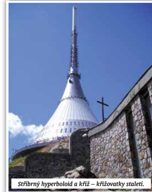
Stříbrný hyperboloid a kříž – křížovatky staletí.

Nevelké krásné pohoří Ještědské, bohaté barevnými skalisky, hlubokými lesy, plné zvěře a ptactva pro celé římské císařství se stalo známým obětavostí svatě Zdislavy ve třináctém století. Mladá Markvartcova žena z Lemberka v Podještědí založila špitál, kde