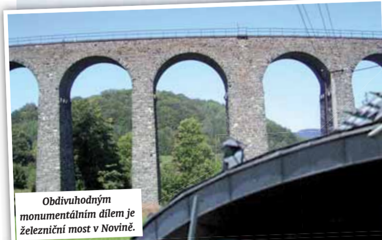
Obdivuhodným monumentálním dílem je železniční most v Novině.