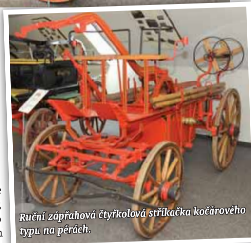
Ruční záprahová čtyřkolová stříkačka kočárového typu na pérách.