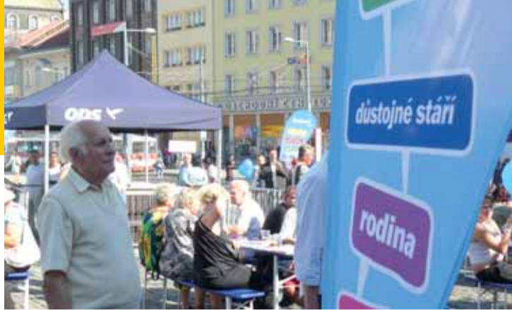
Na Mírovém náměstí se sešli sympatizanti ODS a další obyvatelé Ústí nad Labem.

Ústí nad Labem | Volební kampaň zahájili kandidáti ODS do Poslanecké sněmovny PČR 1. září na Mírovém náměstí v Ústí nad Labem, kde vystavili Městečko řešení a kde představili program, s nímž se hodlají ucházet o hlasy voličů.