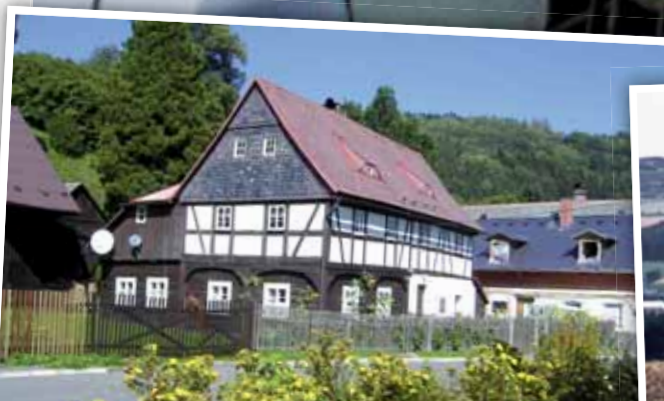
Hrázděné domky jsou typickou germánsko-slovanskou lidovou architekturou.