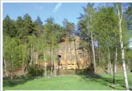
Obydlí poustevníků v Janovických v Podještědí.

Údajnými staviteli Ještědu měli být i čerti. V jeho útrobách hráli karty a strašili ubohá lidská stvoření. Postavili prý u Dubu i čedičovou zed, nazývanou Čertovou, z níž se dobývaly osmihránné sloupky na stavbu mořských hrází v Norsku a Holandsku. Vápenec se používal na výrobu vápna, břídic jako krytina a jako školní sešity. Pískovcem skláří broušili