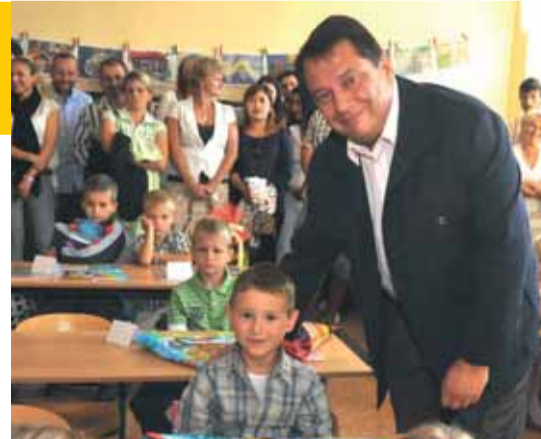
Jiří Paroubek se zúčastnil zahájení nového školního roku v Základní škole Buzulucká v Teplících.

Školskou problematiku nelze podle Jiřího Paroubka neustále