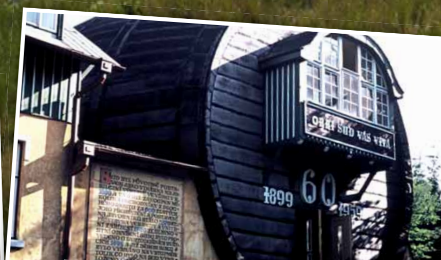
Od roku 1899 navštěvovali lidé jeden z vrcholů Ještědí - Javorník s atrakcí - restaurací v sudu, který si majitel zakoupil ve Vídni.