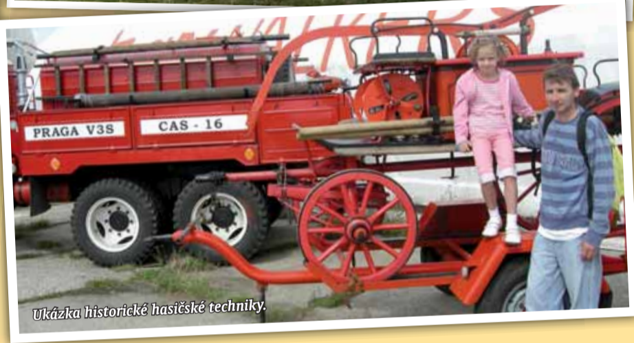
Ukázka historické hasičské techniky.