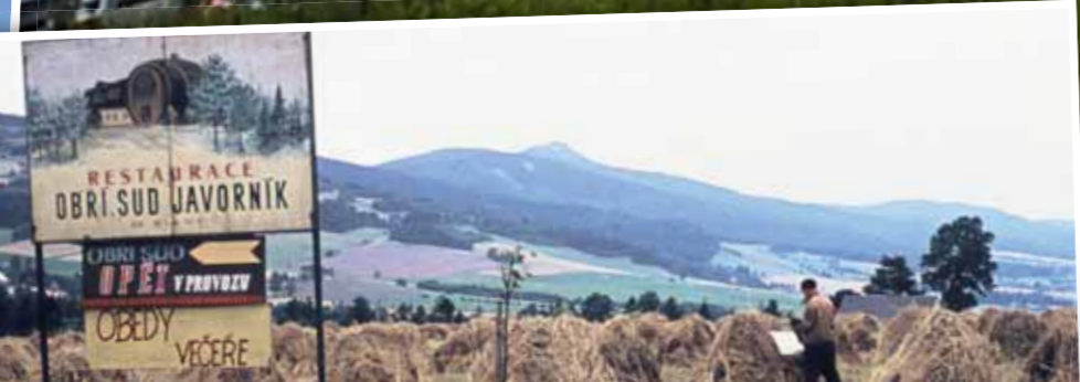
Hospodářství v horách ještě před združstevňováním.