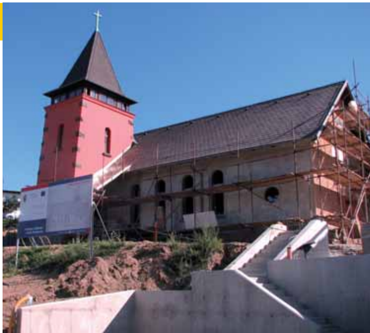
Po šedesáti letech bude evangelický kostelík v Dolní Poustevně dokončen, dnes z něho díky aktivitě zastupitelstva a finančnímu zajištění z Regionálního operačního programu Severozápad vzniká Centrum setkávání.

Původní stavba byla rozšířena o přístavbu, v níž bude kancelář, sociální zařízení, kuchyňka a zázemí pro účinkující. V centru setkávání bude zpřístupněn i ochoz věže, z které bude pěkný výhled na velkou část města. „Jsm rádi, že se podaří zachránit ve městě další zajímavou stavbu,