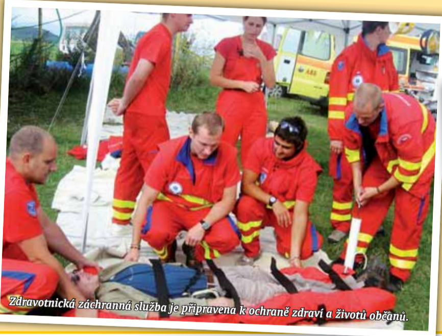
Zdravotnická záchranná služba je připravena k ochraně zdraví a životů občanů.