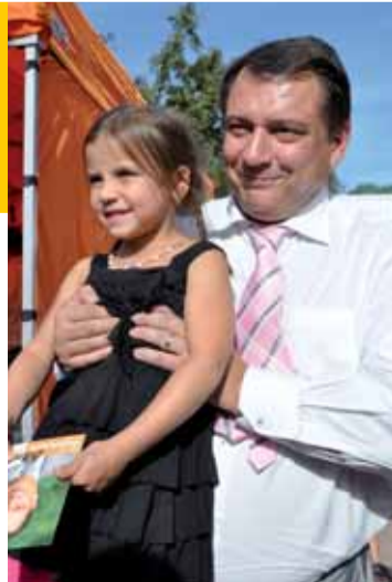
Jiří Paroubek se poslední prázdninový den pozdravil s dětmi v Šanovském parku v Teplících.

Předseda ČSSD a poslanec za Ústecký kraj Jiří Paroubek se netajil tím, že je velmi mile překvapen velkým zájmem Tepličanů. „Docela mě překvapilo, kolik lidí dnes přišlo, spousta dětí s maminkami, babičkami, celé rodiny, odhadem tak patnáct set až dva tisíce lidí, což je velice příjemné zjištění,“ prozradil. Společně s hokejistou Jiřím Šlégrem uspořádali autogramiádu. Odpoledne zpřijemnilo vystoupení skupiny Maxim Turbulence. (eš)