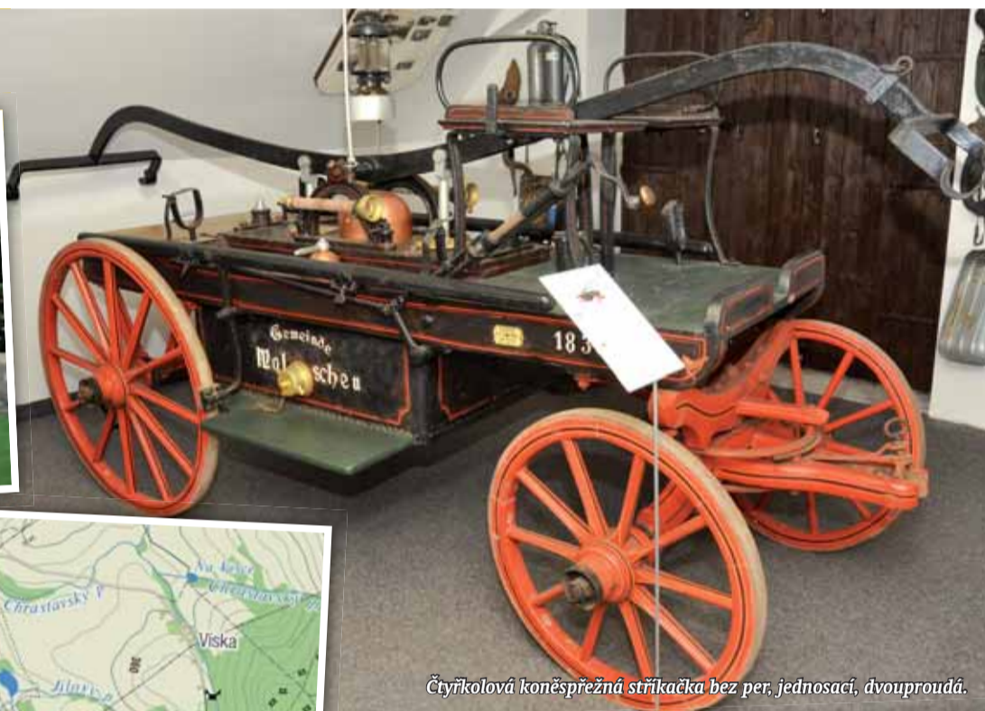
Čtyřkolová koněspřežná stříkačka bez per, jednosací, dvouproudá.