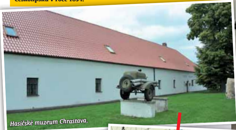
Hasičské muzeum Chrastava.

Chrastava | Organizované dobrovolné hasičské hnutí začalo psát historii na území dnešních Čech a Moravy v první polovině 19. století, kdy jako vůbec první vznikl německý Sbor dobrovolných hasičů v Zákupcech na Českolipsku v roce 1854.