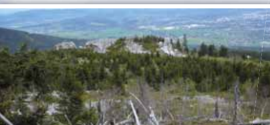
Křemencové pole přerůstají v mohutné skalní útvary – Vířivé skály se podobají Alpickým vrcholům.

Zvěře je na Ještědu přespříliš, poslední medvěd byl zastřelen v roce 1679, ale divočáci a vysoké je v pohoří nesčetné. Kuny, lišky, rozverná a lidskou blízko vyhledávají veverka, na polích spatříte bažan-