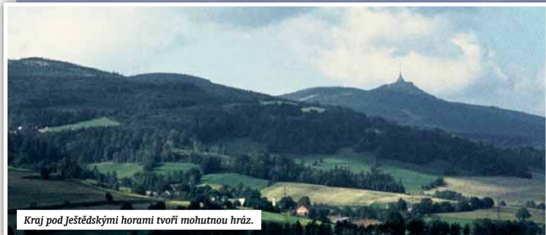
Kraj pod Ještědskými horami tvoří mohutnou hráz.

Spekulativní vykladači jména vznikla nejkrásnější hory naší vlasti si neuvědomují její boží původ a skrze něj z ní vyzárují duchovní síly, zádná sopka či vyvěřelina nebo usazenina. Zkamenělý „Ještěd“ nazývá pohoří Jan Blahoslav v sedmáctém století, Němci nazývají horu dědem – Altwater Jeschken, mýtický vznik však nemá lidský původ, Ještěd byl vytvořen jako boží hora, což předkové potvrzují nevyvrátitelným svědectvím. Nikdo také neví, zda zrovna tady se neodhrál záruk zrození a zda tu nepřistál vesmírným korábem původci života.