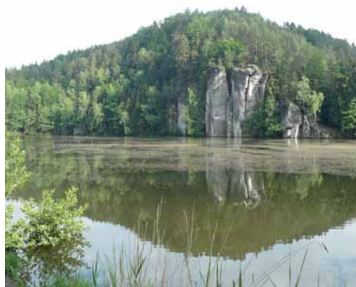
Na břehu Věžického rybníka nacházal princ Bajaja osvěžení. Rybník je známý například z komedie Jak dostat tatínka do polepšovny nebo Āndělská tvář.