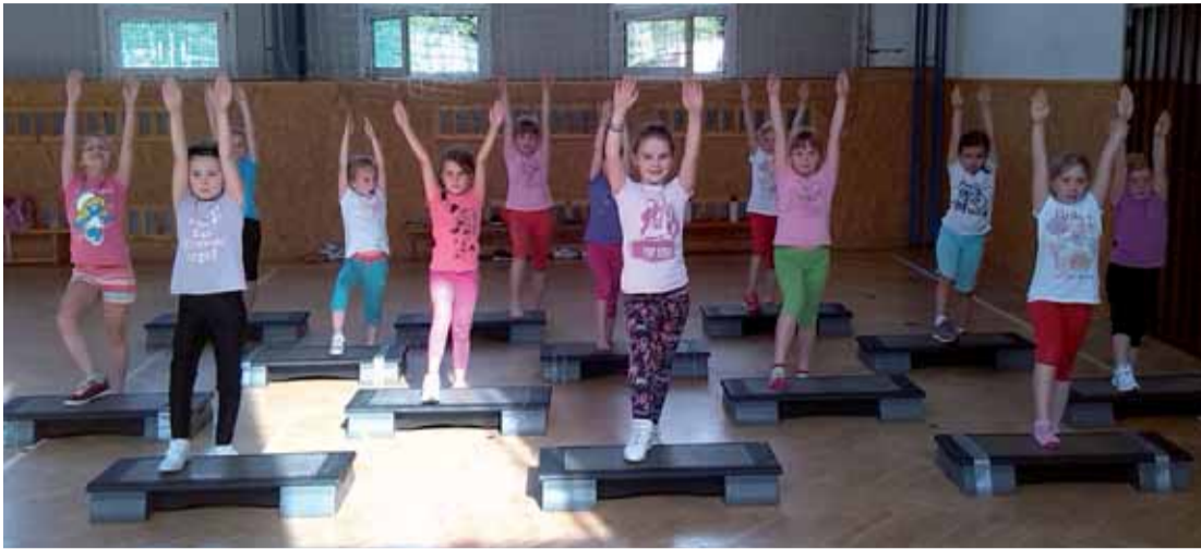
Skupinka nejmladších cvičenek aerobiku.

ké spektrum nabízeného sportovního vyžití pro širokou veřejnost a získala řadu nových členů do svých řad. Na to jsme právem všechny hrdé. Naši hlavní odměnou je dětský smích a spokojení rodiče. Důkazem toho, že když se něco dělá srdcem a ne jen pro peníze a výhody, je řada úspěchů, kterých jsme společně dosáhli. Jen těch sponzorů, kdyby bylo o něco víc. Ptal jste se, proč ve Vratislavicích a ne jinde? Jsem tu doma a Vratislavice jsou můj život, vyrostla jsem tu. Jako děti jsme měly také spoustu vyžití v tomto krásném místě uprostřed přírody, takže se to snažím poslat dál. Co kdysi místní dali mě, teď já dávám jejich vnukům a dětem. Tak by to asi mělo být. Také bych ráda zmínila fakt, že nám