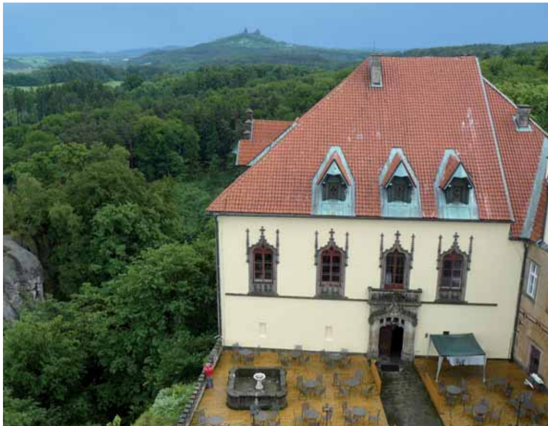
Odměnou po vystoupení na záměckou vyhlídku je pohled na krajinu Českého ráje. Věvodí jí zřícenina Trosky.

O kus dál se lze pokochat u snad nejznámějšího rybníka v Āeskěm