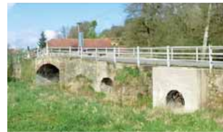
Most přes Výrovku a inundaci před obcí Vrbčany.

„Nejsou nám lhostejné požadavky veřejnosti ani tlak Policie České republiky, představitelů obcí a měst či dopravních správních úřadů. V současné době proto hledáme řešení, jak pro opravy a rekonstrukce mostů investovat v dohledné době minimálně desítky milionů korun,“ uzavřel Miloš Petera, hejtman Středočeského kraje.