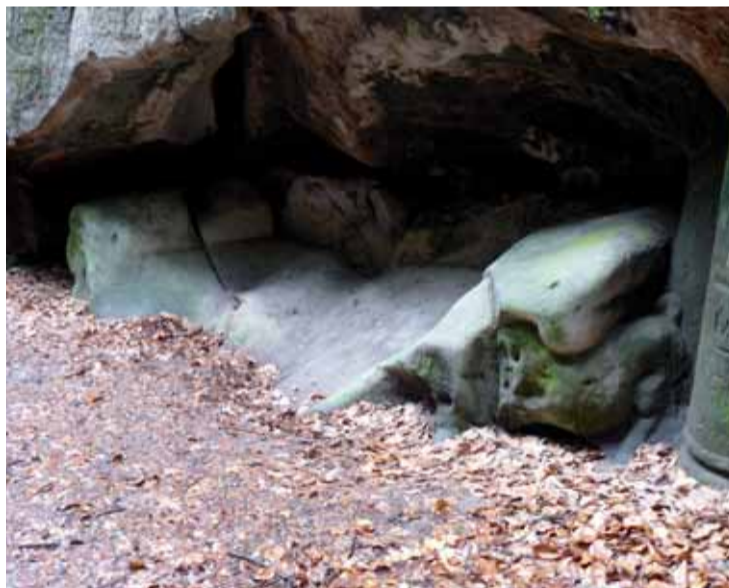
Ze zámku Hrubá Skála vede turistická stezka k Adamovu loži. Tam přespával princ Bajaja a rozmlouval se svým "rádcem" konikem, jehož zachránil před Āerným princem.