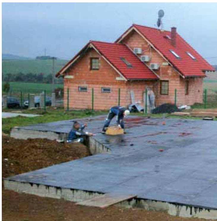
Vyzrálá základová deska se opatří izolací a krátce na to je možné zahájit montáž stavby.

Při výstavbě domu budeme jen těžko hodnotit, která jeho část je důležitější, ale snad se shodneme, že při realizaci můžeme leccos pozměnit, vyměnit či odbourat, ale do základů se už nikdy neodvážíme sáhnout.