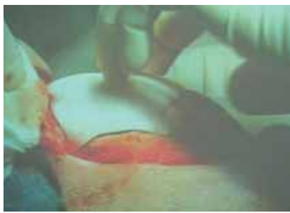
Implantát na defekt na čele lebky pacientky sedl naprosto přesně.