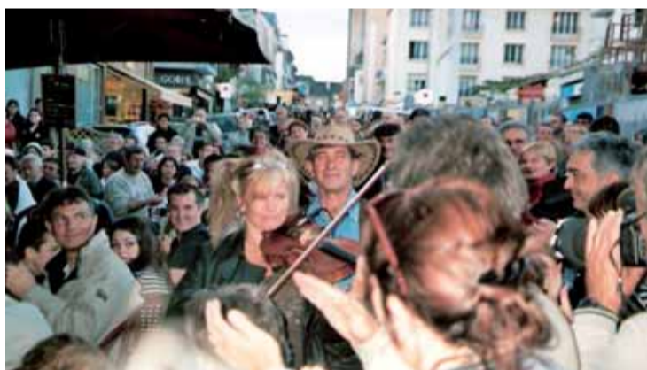
Festival „Keltů“ z celého světa Inter Celtique v Lorientu.