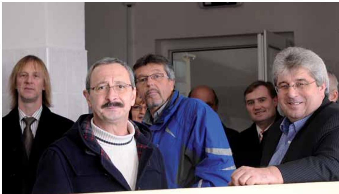
Hejtman Josef Řihák (vpravo) spolu se zaměstnanci čistítky.

Příbramsko | V pátek 8. února navštívil hejtman Středočeského kraje Josef Řihák úpravnu pitné vody u obce Kozíčin, která je jedním z nejvýznamnějších vodních distributorů pro město Příbram.