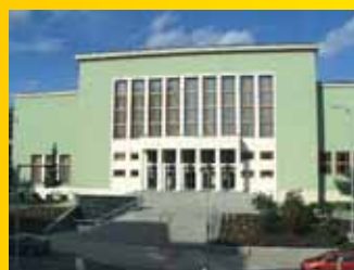
Dům kultury Ústí n.L.