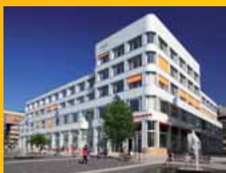
Palác Zdar Ústí n.L.