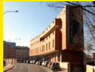
Music city Praha

NABÍDKA PLATÍ I PRO MALOODBĚRATELE A SOUKROMÉ STAVEBNÍKY