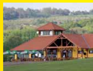
Golfový klub Terasy