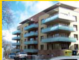
Bytový dům Hvězda Praha