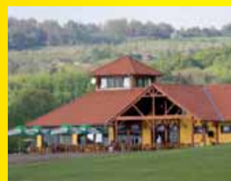
Golfový klub Terasy