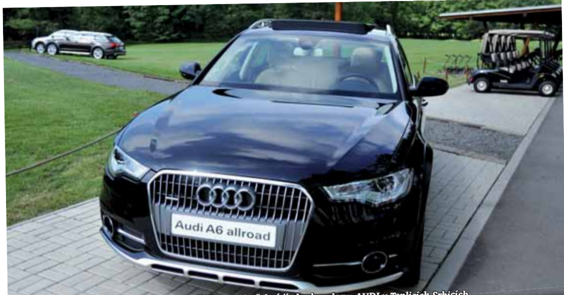
To je on - nový model Audi A6 allroad. Přijďte na zkušební jízdu do salonu AUDI v Teplíčkách-Srbicích.

nu značky AUDI Jana Vobraby, jedná se o zcela novou generaci úspěšného modelu v luxusním provedení, který splňuje náročné požadavky cestujících na výkon, bezpečí i komfort. Se všemi prodávanými značkami vozů AUDI včetně nového modelu i možnosti svezení se mohou zájemci seznámit také v sobotu 23. června od 9 hodin v autosalonu AUDI v Teplíčkách - Srbicích na Dnu otevřených dveří. Pro návštěvníky bude připraveno malé občerstvení a zábavný koutek pro děti. Text a foto: Metropol