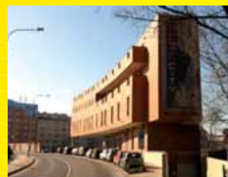
Music city Praha

NABÍDKA PLATÍ I PRO MALOODBĚRATELE A SOUKROMÉ STAVEBNÍKY