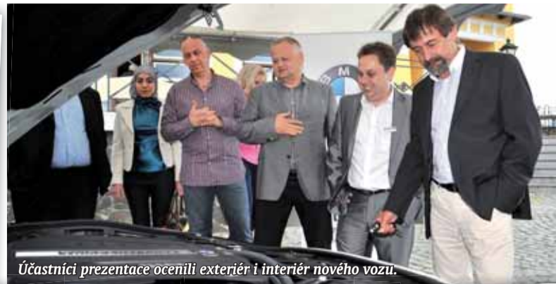
Účastníci prezentace ocenili exteriér i interiér nového vozu.