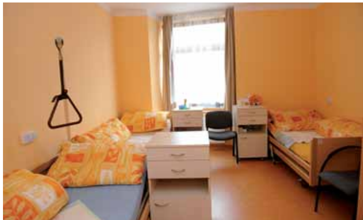
Pokoje jsou většinou dvoulůžkové.

gickými či ošetrovatelskými metody, které jsou součástí komplexní rehabilitační terapie. Nový domov zároveň nabídne také 14 nových pracovních míst. Celkové investiční náklady projektu dosáhly výše cca 19,8 milionu korun včetně DPH. Stavba byla zahájena hejtmánem Davidem Rathem a jeho náměstkem Marcellem Chládkem ke konci března roku 2011 ve velké doposud nevyužitě zahradě.