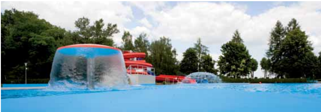
Vodní hřib na koupališti v Kralupech nad Vltavou láká především děti.

Rekonstrukce koupaliště se o titul uchází v kategorii občanské vybavenosti. Do prvního ročníku soutěže mohou být přihlášená stavební díla ze všech oborů dokončená a uvedená do provozu nebo zkolaudovaná v období od 1. ledna 2009 do 29. února 2012. Odborná komise vybere vítěze soutěže v průběhu června. (od dop.)