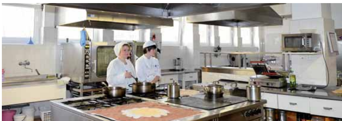
Žáci jsou s novými prostory spokojeni.

Žáci si tak mají kde nacvičit práci kuchaře, číšníka či cukráře. Nové prostory nabídnou možnost vyzkoušet si učební obory v praxi a s vylepšenou restaurací budou spokojeni jak žáci a učitelé, tak i zákazníci. Dřívější restaurace totiž byla velmi nevyhovující,