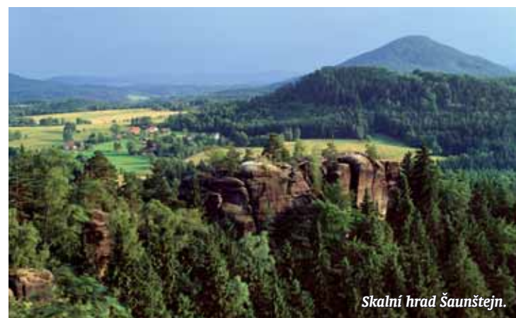
Skální hrad Šaunštejn.

Text: Metropol, foto: V. Sojka a Z. Patzelt, archiv Národního parku