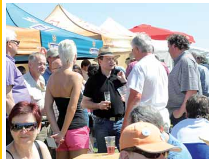
Středočeský hejtmán David Rath na pivním festivalu ve Velké Dobré.

Třetímu ročníku Středočeského pivního festivalu, který se uskutečnil na letišti Velká Dobrá u Kladna, přálo nejen počasí, ale i přízeň návštěvníků, kterých se během dvou dnů přišlo na festival podívat přes dvacet tisíc.