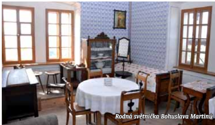
Rodná světnička Bohuslava Martinů