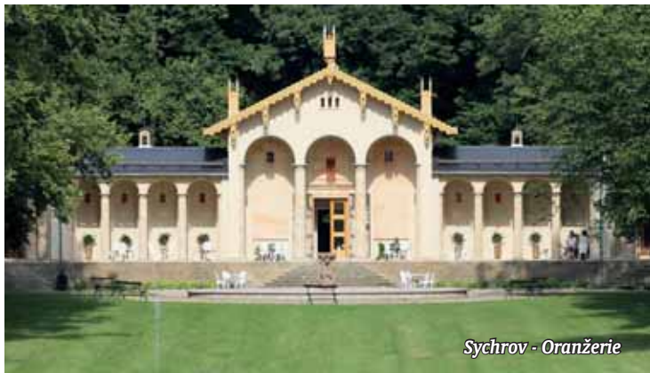
Sychrov - Oranžerie