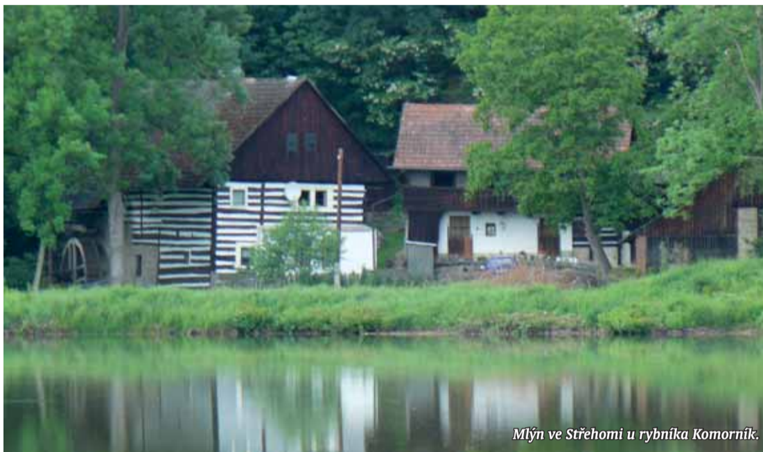
Mlýn ve Střehomi u rybníka Komorník.

Osvěžením ve Střehomském Plakánku může být studánka Roubenka, kam rád chodil a kde získával inspiraci sobotecký rodák, spisovatel Fraňa Šrámek. Kousek za studánkou lze odbočit do Veseckého Plakánku, někdy se mu říká Malý Plakánek, který směřuje do Vesce u Šrámkovy Sobotky. Vesec je od roku 1995 památkovou rezervací. Má okrouhlou náves se sousoším Nejsvětější Trojice z roku 1834, vytesali ho přímo na místě z kamene z Plakánku.