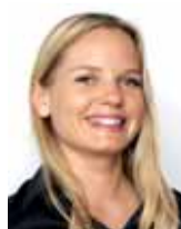
Kateřina Klasnová, místopředsedkyně Poslanecké sněmovny (VV):

Novému titulu přeji, aby mohl psát dobré zprávy a přesto o něj byl mezi čtenáři zájem. Zkrátka, aby Středočechům nabídl informace, zába- vu i pomoc.