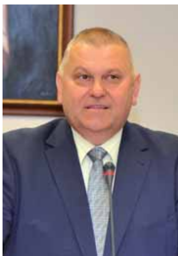
Miloš Petera, náměstek hejtmána pro oblast životního prostředí a zemědělství

videlně monitorován, nebo likvidací srážkových vod z letových ploch, které budou odváděny přes kanál a čističku. K vydání souhlasného stanoviska k rozšíření vodochodského letiště nás vedlo několik důvodů. Jednak je to jednoznačně pozitivní ekonomický dopad na celý mikroregion, jednak možnost vytvoření stovek nových pracovních míst. Neopomeňme také fakt, že obyvatelé přílehlých měst budou mít výhodu bližší dopravní dostupnosti letiště.