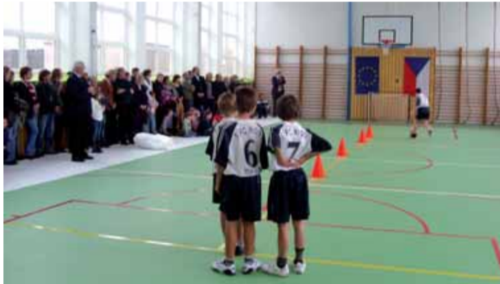
Nová tělocvična v Dolních Kralovicích.

V obci Studené řešili otázku, co se starou školou, v současnosti již nevyužívanou. Rozhodnutí bylo zrekonstruovat ji s možností využití pro všechny občany. Dnes už je hotová přístavba, opravená střecha a venkovní fasáda a postupují prá-