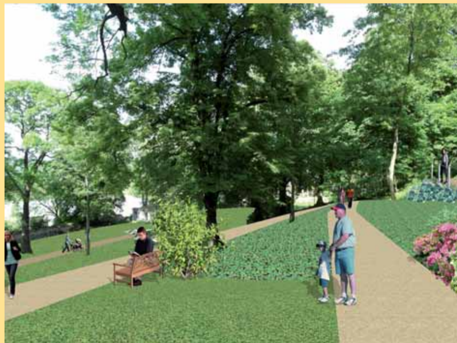
Kraj opravuje památky a staví parky. Na snímku plánovaná podoba zahrad v Buštěhradu.

Středočeský kraj se může pochlubit mnoha významnými místy. Mezi ně jistě patří zámek Buštěhrad či Galerie Středočeského kraje, která sídlí v historické Jezuitské koleji v Kutné Hoře. V obou těchto významných kulturních památkách probíhají nyní zásadní rekonstrukce.