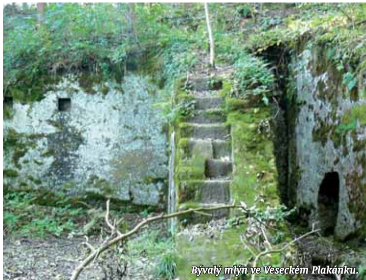
Bývalý mlýn ve Veseckém Plakánku.