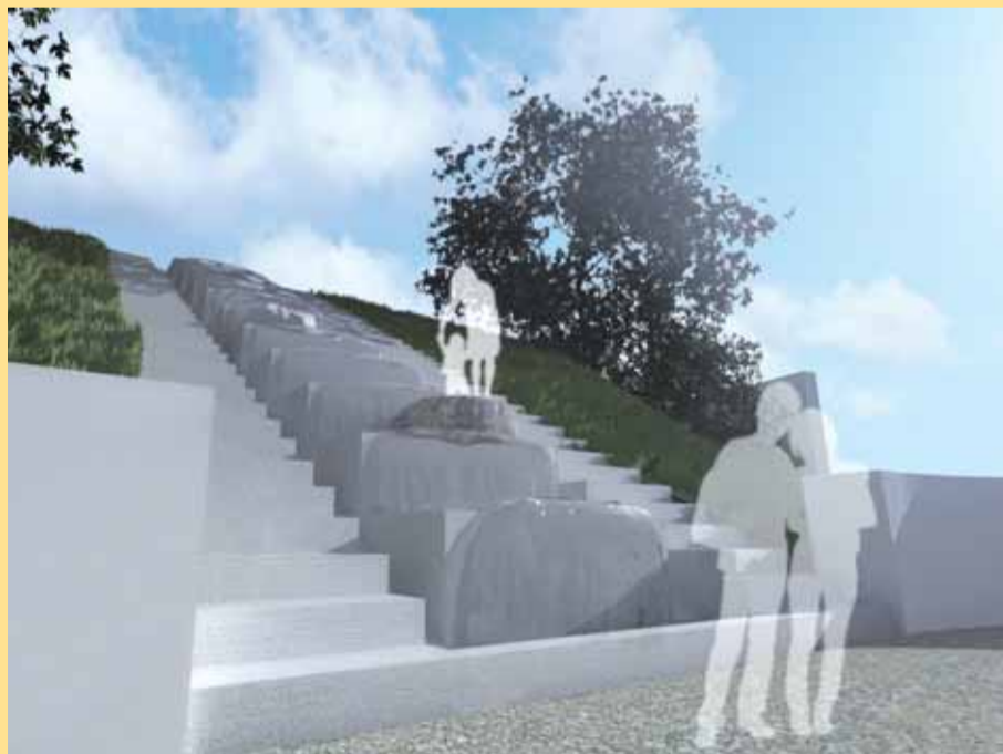
Významným prvkem zahrad u Jezuitské koleje budou vodní schody.

hrad totiž už několik chátará a město, kterému patřil, si s ním nevědělo rady. Na opravy nemělo dostatek peněz a se zchátralým zámek nemohlo nic dělat. Proto se Středočeský kraj rozhodl městu pomoci a na podzim loňského roku buštěhradský zámek převzal s tím, že mu vrátí jeho původní slávu.