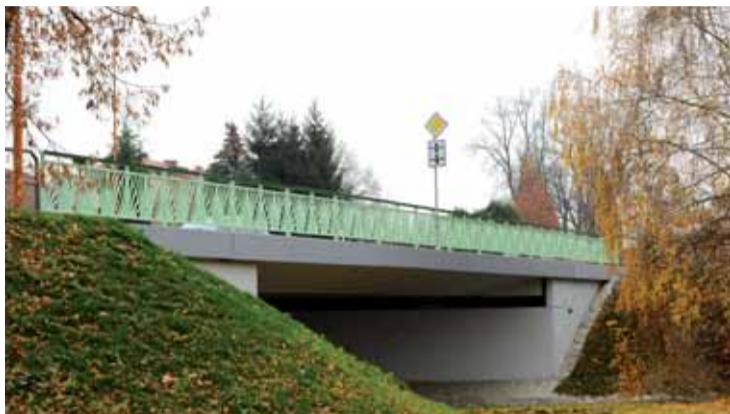
Most přes Ostrovský potok

pro pěší přes Ostrovský potok. Realizace projektu byla zahájena v květnu 2010. Celkové náklady projektu dosáhly výše 36 005 400 korun, z toho výše dotace z Regionálního operačního programu Střední Čechy činila 31 033 282 korun. (od dop.)