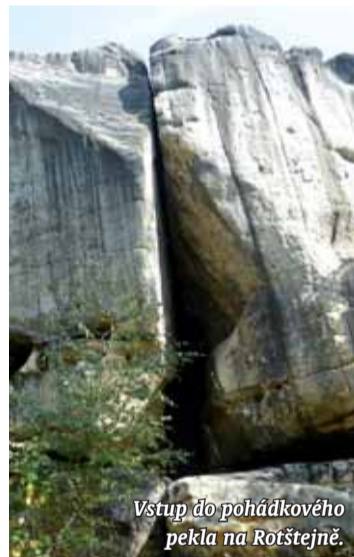
Vstup do pohádkového pekla na Rotštejně.