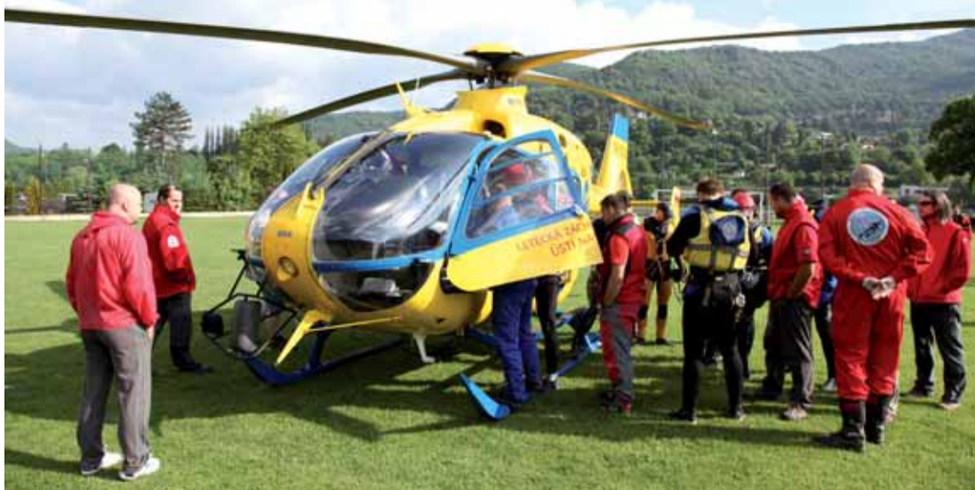
Ilustrační foto z jarního cvičení leteckých záchranářů ve Vaňově na Ústecku.

Ústecký kraj každoročně přispívá při odborném výcviku leteckých záchranářů na provoz vrtulníku 500 tisíc korun. Odborný výcvik si dále vyžádá částku asi 200 tis. Kč, která