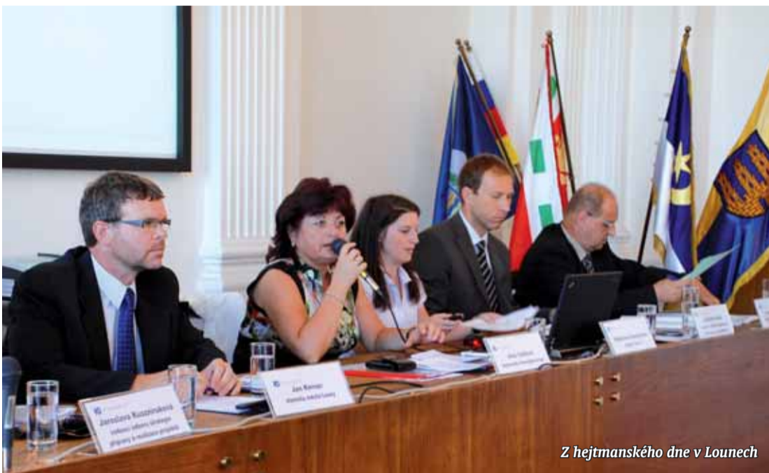
Z hejtmanského dne v Lounech