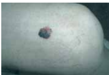
Výrazná skvrnitá pigmentace a asymetrie superficiálně se šířícího melanomu je nejčastější klinickou variantou představující přibližně 70 – 75% všech kožních melanomů.

Toho si jsou specialisté z kožního pracoviště chomutovské nemocnice, které je zároveň centrem péče o maligní mela-