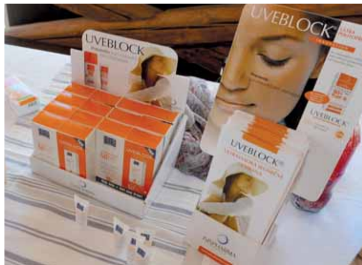
Na trhu je v dnešní době dostatečná škála ochranných prostředků s vysokým filtrem, stačí si zodpovědně vybrat a postupovat podle návodu.