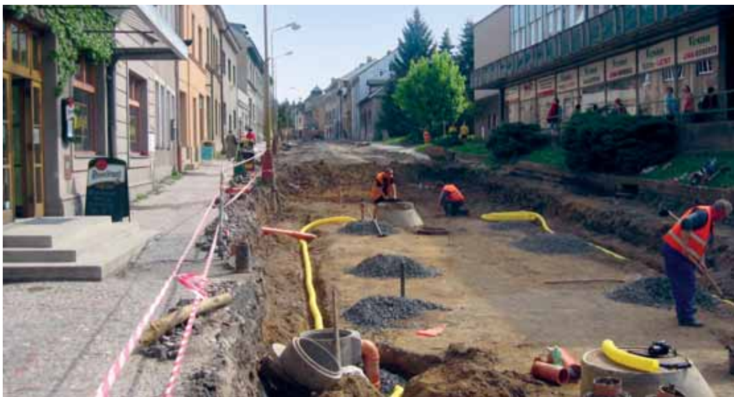
Rekonstrukce ulice 5. května v Turnově

Další velkou investiční akcí je „Rekonstrukce ulice 5. května v Turnově“, s náklady 52 mil. korun. V rámci projektu bude opravena ulice 5. května v úseku od Havlíčkova náměstí až po křižovatku ulic Hruštic – Károvska. V místě původní silnice bude vybudována nová vozovka. Součástí rekonstrukce je také vybudování jedné miniokružní křižovatky na rozcestí ulic Husova a Kinského a výstavba okružní křižovatky na křižovatce Hruštic – Károvska. Rekonstrukce ulice 5. května v Turnově obsahuje i napojení a úpravu stávajících křižovatek v celé délce této ulice, zejména úpravu křižovatky u nemocnice a napojení nové komunikace propojující Zelenou Cestu s ulicí 5. května, kde bude stávající napojení zrušeno pro automobilovou