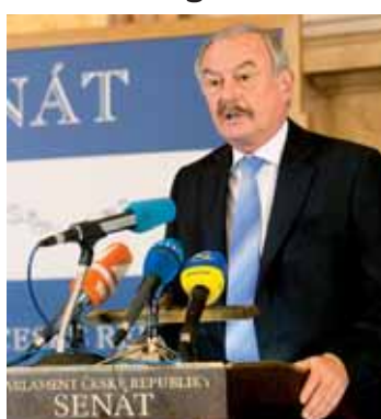
Přemysl Sobotka, 1. místopředseda Senátu PČR.

ování nové dopravní železniční trasy zaznělo již na setkání členů Rady LK s představiteli Generálního ředitelství Českých drah, které proběhlo 17. května v Liberci. Obě strany se shodly na tom, že vybudování koridoru napomůže k rychlejšímu cestování občanů mezi Prahou a Libercem. (od dop.)