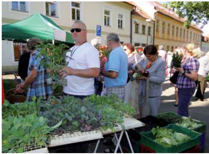
Premiéru měly farmářské trhy na Škroupově náměstí v České Lípě ve čtvrtek 26. května.

Česká Lípa | Navázat na historii tržního náměstí v centru města a nabídnout občanům České Lípy čerstvé produkty od regionálních producentů bylo hlavním důvodem, proč vedení města kývno na pravidelné pořádání farmářských trhů na Škroupově náměstí.