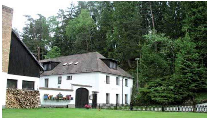
Martinský mlýn v Hrádku u Trhových Svinů.

Text: Radek Kraus