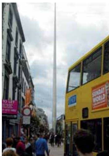
Srdce Dublinu - Spire of Dublin. 120 metrů vysoká kovová jehla.

Dublin je pro většinu turistů pomyslnou vstupní branou do země. Tepající kosmopolitní velkoměsto s milionem obyvatel, které vás na O'Connell Street probodne jehlou. Nepřehlédnutelný monument Spire of Dublin - kovová jehla s průměrem v základu tři metry a ve vrcholových 120 metrech jen 15 centimetrů, váží 126 tun - slouží jako dobrý orientační bod (pro cizince) a místo schůzek (pro milence). Severně od Spire zhruba 10 minut chůze