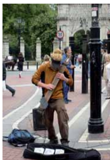
Grafton Street je plná živé hudby.

i módních podniků, rázovitých pubů. Svoji kariéru zde údajně odstartovala i slavná irská rocková skupina U2.