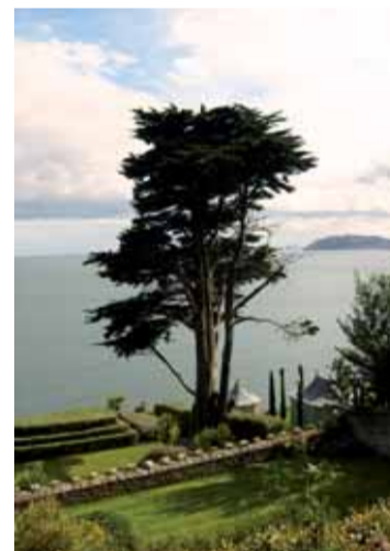
Pohled na zahradu rezidence Bono Vox v Killiney.

bízí rozhledna O'Brien's Tower. Nedaleko města Galway můžete vidět i největší středověký kostel v zemi - St. Nicholas Church z roku 1320. Země zeleného trojlístku má šmrnc, poetiku i originalitu. Unikem jsou kohoutky rozdělené na teplou a stu-