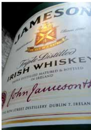
V Irsku se vyrábí jedna z nejlepších whisky na světě.

se nachází Writers Museum. V gregoriánské městské rezidenci z 18. století můžete za šest euro vidět vestu, kterou nosil James Joyce i cenná první vydání děl Oskara Wilda. Nezřídka jsou milovníci literatury i milovníky whisky. Jedna z nejlepších whisky na světě Jameson se vyrábí v destilárně poblíž Mary's Lane. Můžete navštívit muzeum Jameson (vstup dospělí - 12 euro, studenti - 9 euro) a vidět celý proces proměny