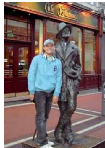
Autor se sochou literáta Jamese Joyce.

Své kouzlo mají také Mohérové útesy na západě. Z Atlantiku se tyčí místy až do výšky 200m a táhnou se v délce osmi kilometrů. Nejlepší výhled na tento imponantní přírodní útvar na-