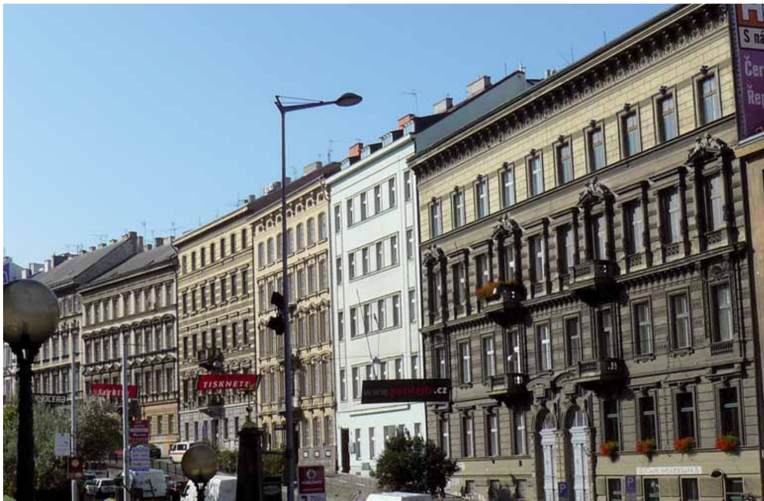
Na Pražany čeká od Nového roku zvýšení nájemného. V některých lokalitách může být činže vyšší až o 46 procent.

může zvýšit o nejruznější přírůstky (nižší i vyšší než 30 %). To na druhé straně neznamená, že „lidé skončí bez střechy nad hlavou, protože nebudou schopni takovou výši platit“. Při zvýšení nájemného ve výši 15 Kč/m 2 třeba i o 100 %, tj. na 30 Kč/m 2 , což v 60 m 2 velkém bytě představuje 1 800 Kč/m 2 , nedopadá na nájemce v takové míře jako procentuálně výrazně nižší přírůstek nájemného vysokého.