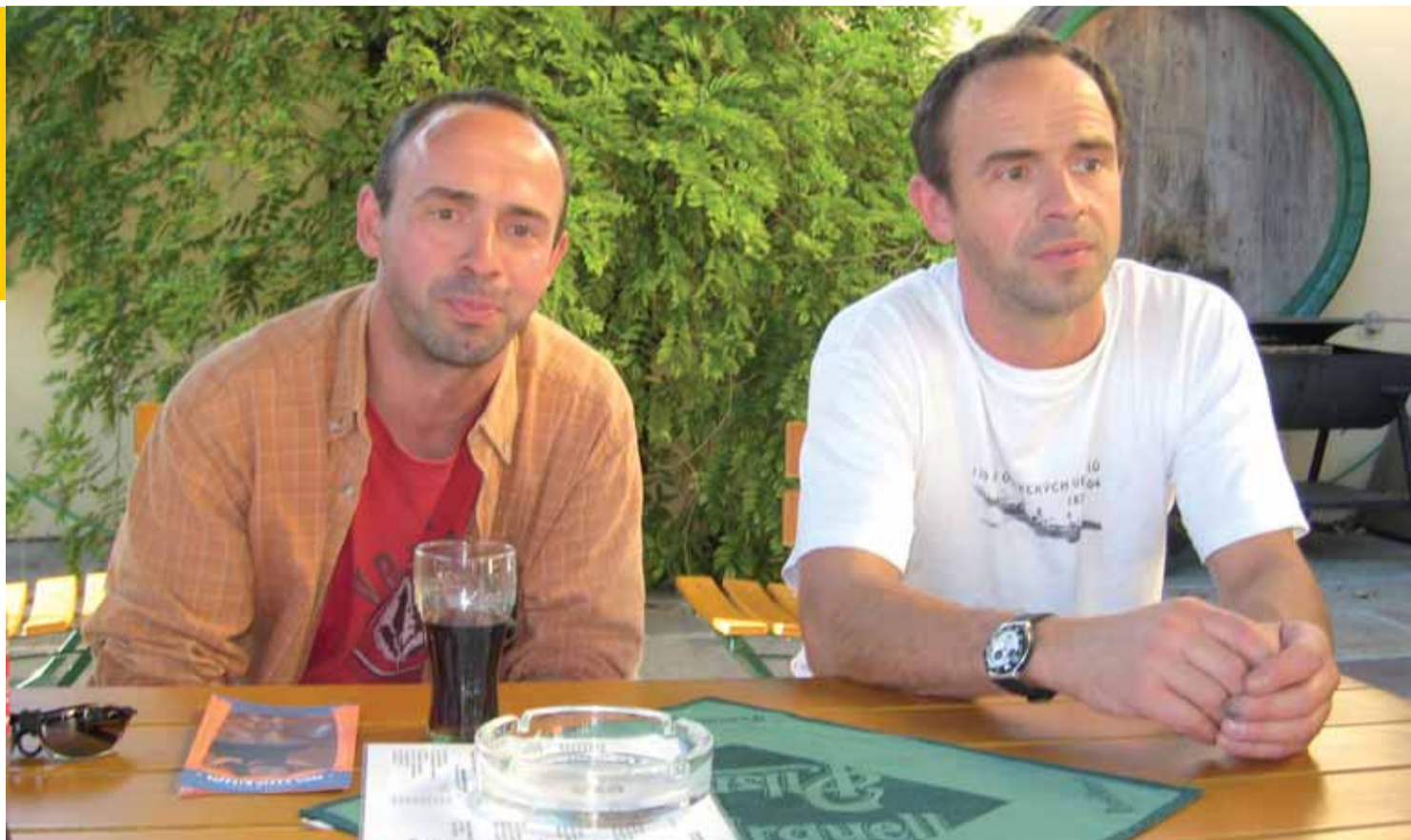
Bratři Formanovi přivezli do Plzně zbrusu novou vlastní inscenaci Obludarium.

Petr: Nejdůležitější bylo přepnout při hraní do češtiny. To je jazyk, který nejvíc ovládáme, a o to větší jsme měli strach. V cizině s tím problémem nemáme. Tam hrajeme v jazyce, kde si ani neuvědomujeme jemné nuance. Většina textu je improvizovaná