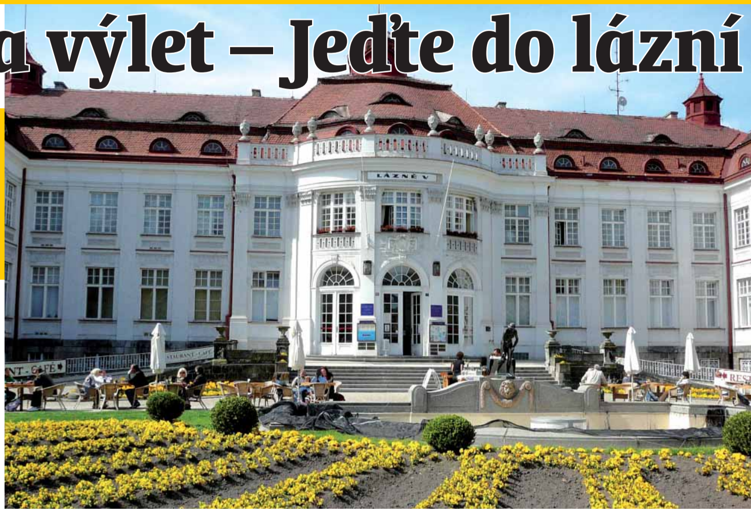
Karlovy Vary jsou skvělou volbou na potíže s trávením.

Které z šesti místních lázní si ale vybrat? V případě, že si chcete vylepšit svůj zdravotní stav a zbavit se některých neduhů, buďte vám vodítkem seznam indikací. Na potíže s trávením jsou skvělou volbou Karlovy Vary. Tady vyvěrá kolem osmi desítek termálních pramenů, jejichž teplota se pohybuje mezi 30 až 70 stupni. Oblíbeným výletním místem je Jelení skok se soškou Kamzíka.