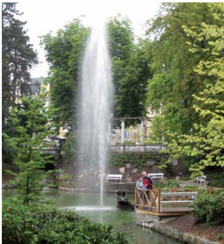
Mariánské Lázně jsou krásné v létě i v zimě. Pokud se chcete napít léčivých pramenů, projděte si kolonádu.