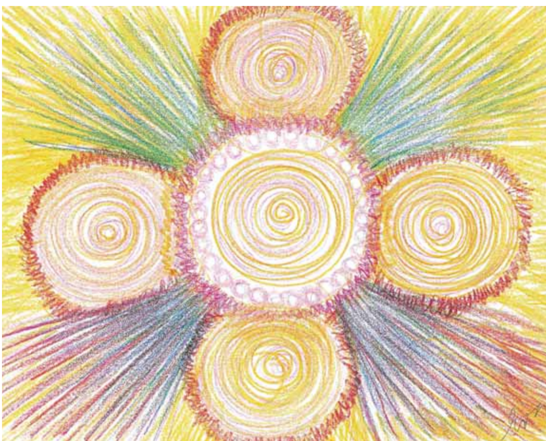
Tento obrázek dodává energii a harmonizuje na všech úrovních: fyzické, mentální, emocionální a duchovní.

Při zasvěcení do prvního stupně Mistr Reiki předává adeptovi iniciaci energetických center (čaker) schopnost přijímat a předávat energii Reiki. Mnozí iniciáti již po prvním zasvěcení cítí zvýšenou intuici a větší chuť do života. Díky zvýšenému příjmu