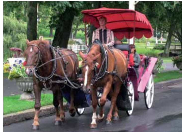
Mariánskými Lázněmi se můžete nejen procházet, ale zajímavá místa můžete projet i kočárem taženým koňským zpřežením.