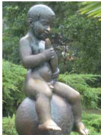
Socha malého Františka ve Františkových Lázních je symbolem pro ženy, které nemohou otěhotnět. Pověrami opředená socha je lákadlem pro lázeňské hosty.