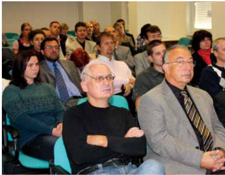
Pohled na účastníky semináře.