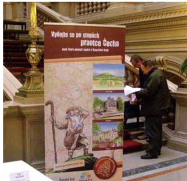
Vestibul pražského Národního muzea, v němž se významně prezentuje Ústecký kraj a jeho historie a pamětihodnosti.