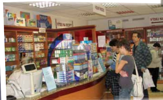
Dalším dárkem pro návštěvníky byla možnost výhodného nákupu volně prodejných léků a zdravotnických pomůcek v nemocniční lékárně.