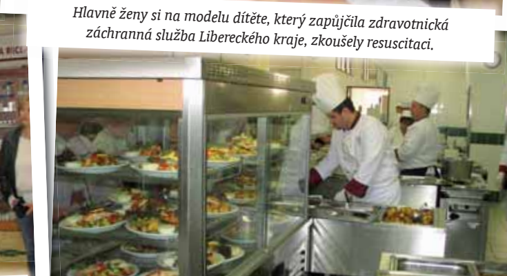
Příjemným překvapením na konec dne byl oběd, který si mohli návštěvníci vybrat ze šesti jídel, které pro ně připravil stravovací provoz nemocnice.