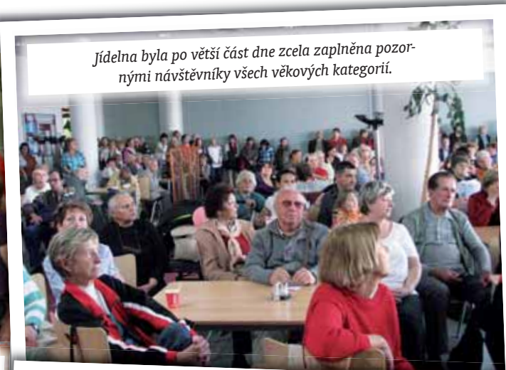
Jídelna byla po větší část dne zcela zaplněna pozornými návštěvníky všech věkových kategorií.