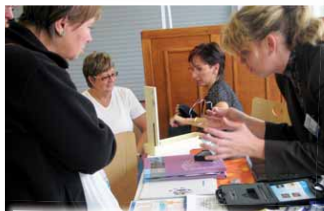
Zájem lidí byl o měření krevního tlaku, o informace k léčbě infarktu a dalších nemocí srdce.