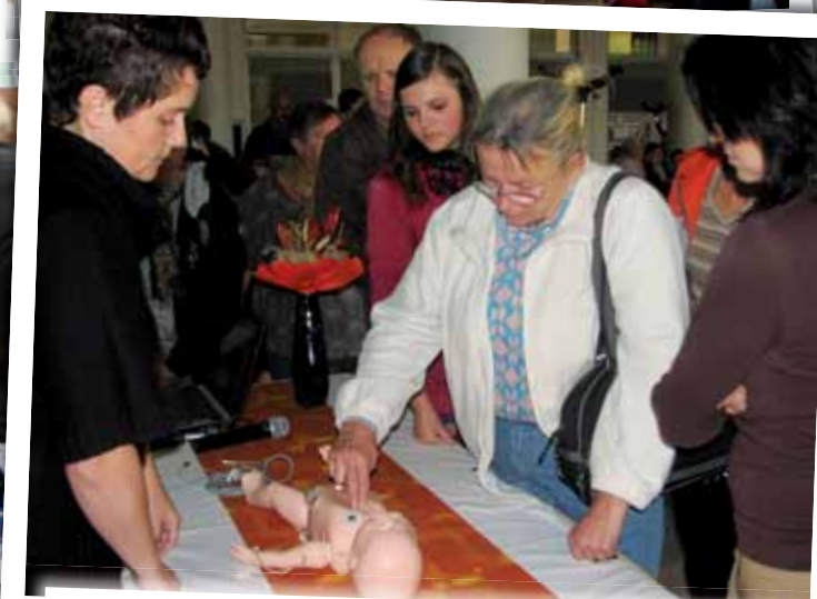
Hlavně ženy si na modelu dítěte, který zapůjčila zdravotnická záchranná služba Libereckého kraje, zkušely resuscitaci.