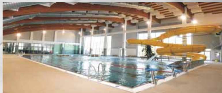
Centrum vodní zábavy Kdyně