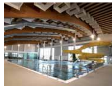
Centrum vodní zábavy, Kdyně. Interiér a exteriér.

Podobná ocenění si odnesla společnost Eurovia za silniční most v Roudném nebo trutnovský BAK za multifunkční areál Farma Čapí hnízdo ve středočeských Olbramovicích.