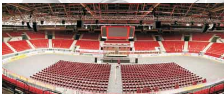
Výstavní, sportovně kulturní, kongresové centrum Karlovy Vary