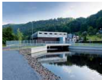
Vodní elektrárna v Železném Brodě.