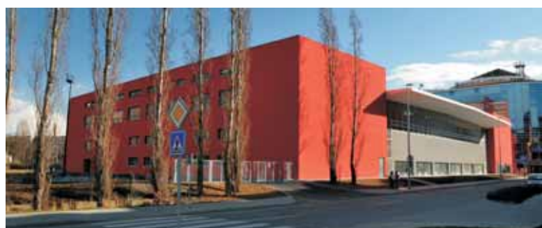
Atletická hala AC Sparta Praha