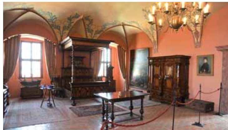
Pohled do ložnice Jiřího Kristiána Lobkowicze.