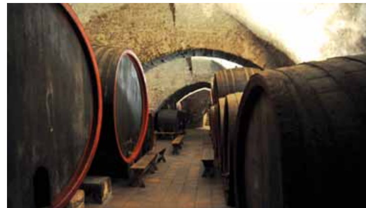
Staletími prověřené zámecké sklepy Lobkowického vinařství.