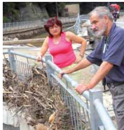
dostávám já i další členové vedení Ústeckého kraje nabídky od spousty organizací – nabízejí technickou i humanitární pomoc, levnější

Pomoci může bez přehánění každý; občan, firma, společnost. Hned po opadnutí vody byly v postiženém území zahájeny práce na odstraňování prvotních škod z povodní z počátku srpna. Zapojili se do nich vedle vojáků a členů všech složek Integrovaného záchraného systému Ústeckého kraje také dobrovolníci, členové neziskových organizací, významnými finančními dary přispívají některé kraje České republiky i Asociace krajů ČR a očekáváme i pomoc naší vlády. Doslova každou hodinou