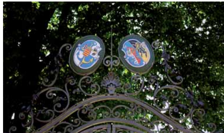
Výzdoba vstupní brány sokolovského zámku.