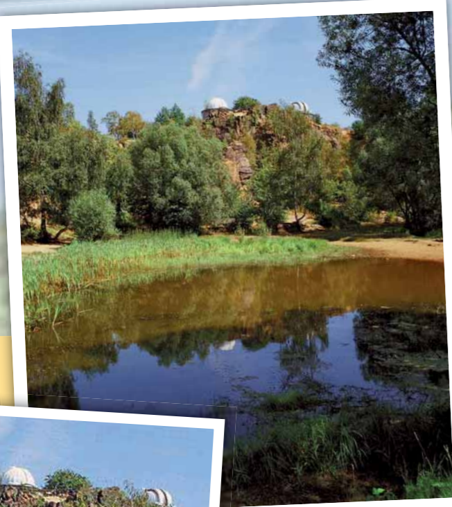
Hvězdárna a planetárium