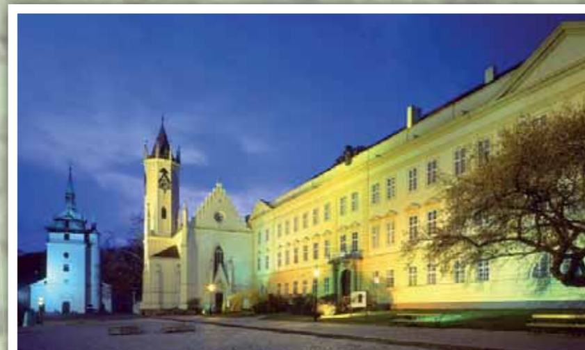
Regionální muzeum Teplice