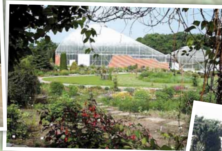
Botanická zahrada Teplice