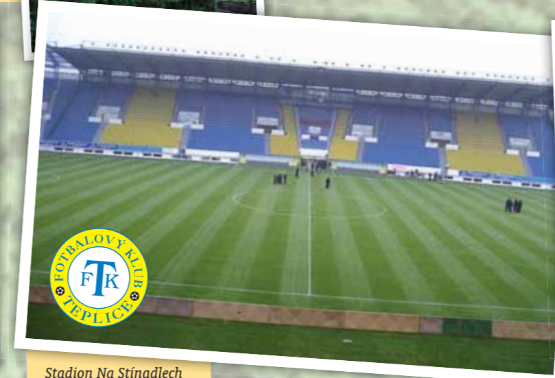
Stadion Na Stínadlech