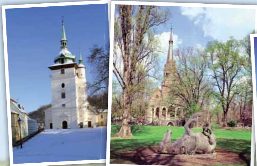
Děkanský kostel sv. Jana Křtitele, Kostel sv. Alžběty v Šanově, Kostel sv. Bartoloměje