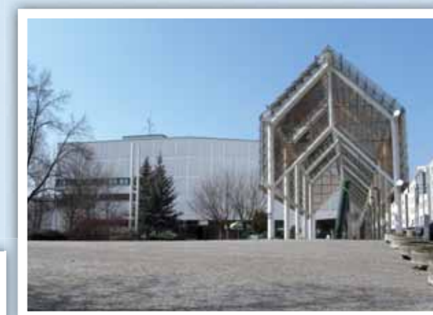
Dům kultury Teplice