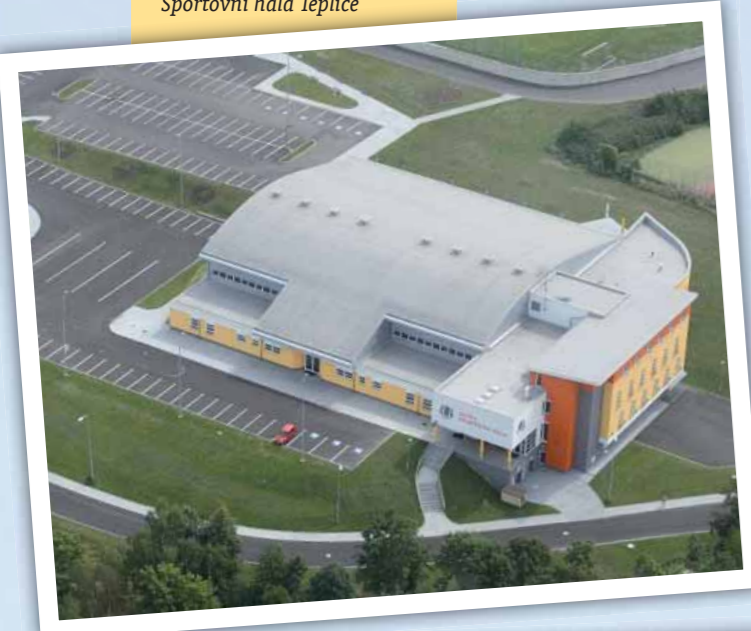
Sportovní hala Teplice