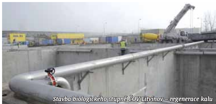
Stavba biologického stupně ČOV Litvínov - regenerace kalu