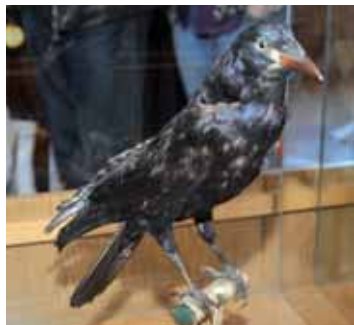
Havran „hlídá“ všechny rekvizity ve vitríně na Červeném Hrádku.