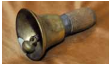
Kouzelný zvoneček, kterým všechno začalo a také skončilo.

Červený Hrádek u Jirkova | Kdo by neznal princeznu Arabelu, o kterou usiloval čaroděj II. kategorie Rumburak? Vždyť první série třináctidílného pohádkového seriálu Miloše Macourka a Václava Vorlička vznikla před třiceti lety (1979 - 1980). Z těch, co tehdy byli dětmi, jsou dnes dospělí a na Arabelu se dívají jejich děti.