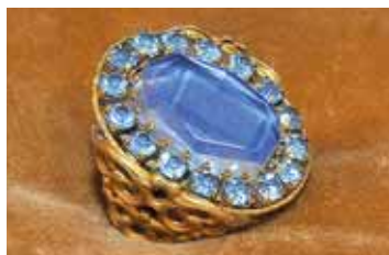
Kouzelný prsten, jediný dochovaný ze seriálu o princezně Arabele.