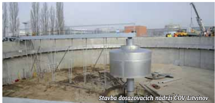
Stavba dosazovacích nádrží ČOV Litvínov

Jsem zastánce pití vody z vodovodu. Je stále čerstvá. Pití vody z vodovodu je navíc ekologické a ekonomické. Za litr balené vody zaplatíte řádově stokrát víc než za vodu z vodovodu, musíte ji navíc přepravovat a většina PET lahví pak končí ve spalovnách nebo na skládkách. (met)