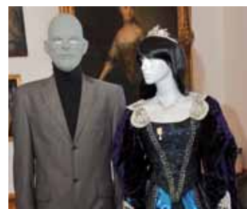
Fantomas a princezna Xenie