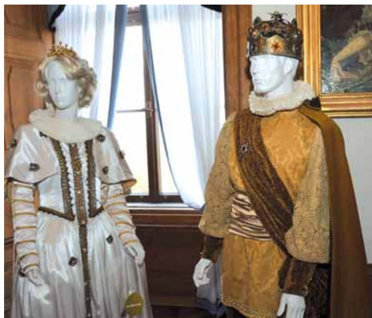
Královna a král Hyacint II., rodiče princezny Arabely