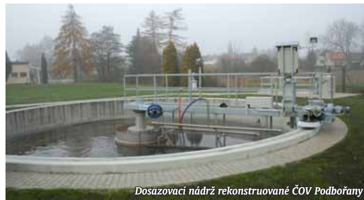
Dosazovací nádrž rekonstruované ČOV Podbořany

Takže počítáte i nadále s dotacemi? Samozřejmě, že možnosti jejich získání