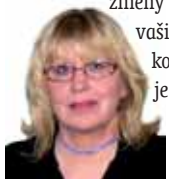
Připravila: Ludmila Petřiková

Řyby 20. 2. - 20. 3. Březen je váš měsíc, ale nebývá zpravidla obdobím klidu a pohody. Bouřlivé změny počasí ovlivňují jak vaši psychiku, tak fyzickou schránku, která je po zimě oslabená. Rovnováhu hledejte v literatuře.