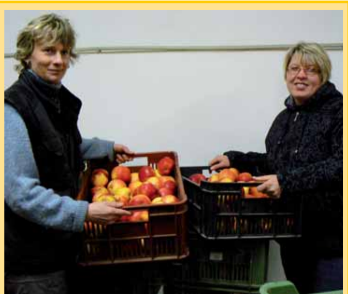
Taková krásná jablka vysrostla v sádkách v Nebílověch na Plzeňsku. Nyní jsou v prodeji také v Pěšicích na náměstí, kde kromě několika druhů jablek nakoupíte i první mošt i mošt pasterizovaný v pitulitovém balení, který si sad nově vyrábí z vlastní sklizně.

Vstupenky je možno zakoupit v Informačním centru města Plzně na náměstí Republiky 41.