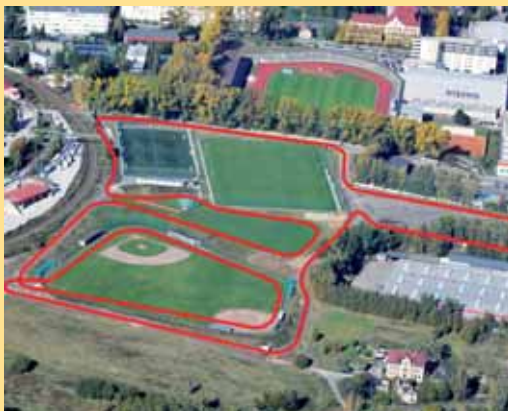
Běžecský okruh u Tipsport areny má veřejnost zdarma.

„Stopy jsou připraveny pro klasickou techniku a bude me je upravovat každý den, dokud bude v areálu dostatek přírodního sněhu. Veřejnost má na běžecský okruh přístup zcela zdarma. Část okruhu je osvětlena do 22. hodiny,“ uvedl jednatel společnosti Lukáš Přinda.