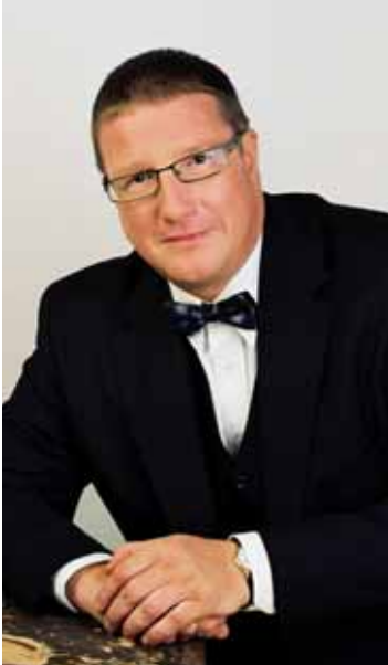
Primátor města Liberec Jiří Kittner

Liberec | Statutární město Liberec se ve spolupráci s Městskou policií Liberec rozhodlo posílit bezpečnost na sjezdovkách na Ještědu. V rámci ochrany bezpečnosti a zdraví lyžařů se na nich nově objeví strážníci městské policie na lyžích, kteří budou dohlížet na provoz na ještědských sjezdovkách. V létě tyto strážníci, kteří budou sloužit jako okrskáři pro danou lokalitu, zamění lyže za kola a budou celou oblast kontrolovat a hlídat ji.