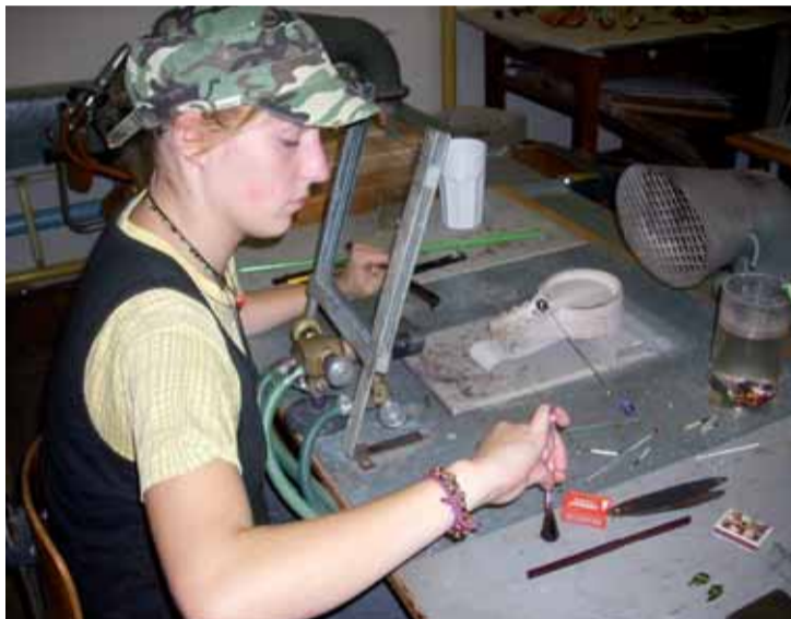
Zimní sklářské pátky začínají v dílnách SUPŠD sklářské v Železném Brodě.

V době školních prázdnin, které připadají na 31. ledna a 12. února 2010, je ve sklářské škole přístupna pouze prodejna, exkurze není v tyto dny možná. Avšak po oba dva tyto pátky můžete absolvovat exkurzi