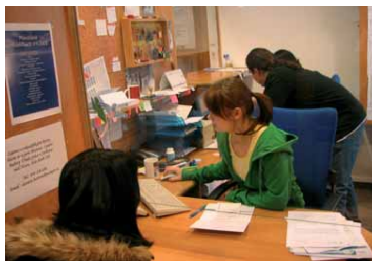
Pracoviště Úřadu práce v Jablonci nad Nisou.

■ Můžete uvést příklady, jak je možné řešit nepříznivou situaci v nezaměstnanosti?