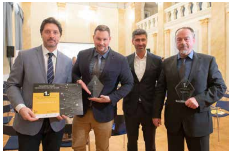
Vítězové obou kategorií, zástupci Chart Ferox a Pardam.

Za rok 2023 soutěž odstartovala už na jaře, přihlášky je možné podávat až do 11. listopadu tohoto roku a vše je online. „Příhlašku do soutěže může podat zástupce příslušné firmy, anebo třetí osoba s jejím vědomím a souhlasem. Příhlaška je jednoduchá a je možné ji zvládnout za chvíli, pokud člověk svou firmu a přihlašovanou inovaci zná. Hodí se určitě připojit fotografii či jiné materiály o inovaci, aby porota měla relevantní podklady,“ dodává Klein. Podmínkou také je, aby inovace byla realizovaná, anebo ve finální fázi a zároveň nebyla starší tří let. Firma by měla mít v regionu své sídlo, nebo alespoň provozovnu. Soutěže se firma může zúčastnit každý rok, ne však se stejnou inovací. Podmínky soutěže jsou na webových stránkách icuk.cz.