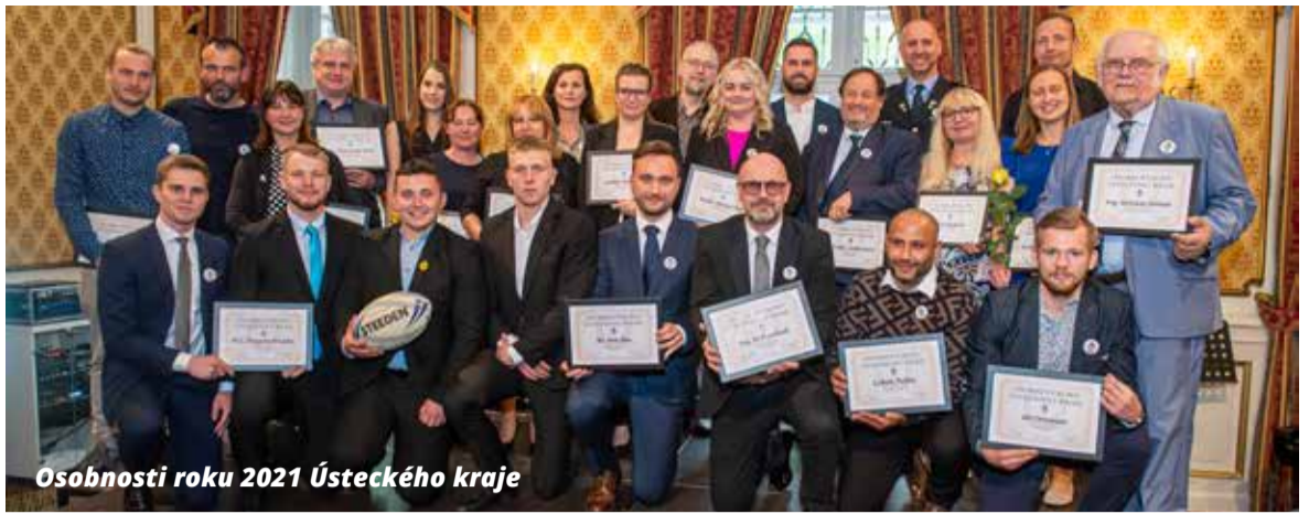
Osobnosti roku 2021 Ústeckého kraje