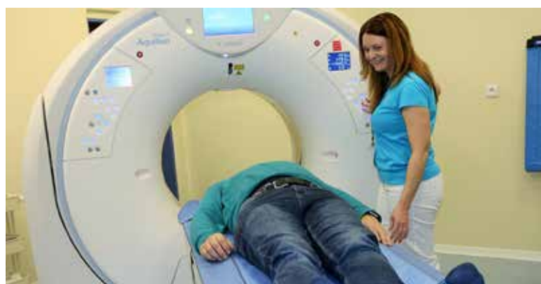
Prezentace nového CT přístroje v litoměřické nemocnici 25. 1. 2023.