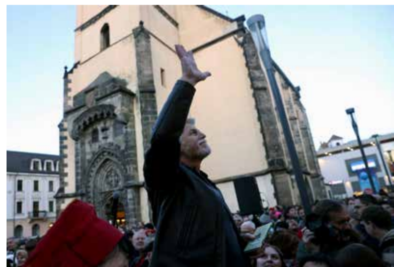
Armádní generál zdraví příznivce na ochozech ústeckého OC Forum.