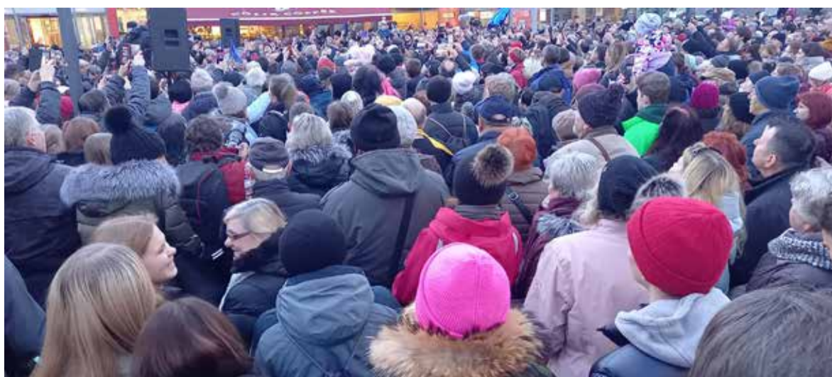
Předvolební mítink Petra Pavla na Kostelním náměstí v Ústí nad Labem.