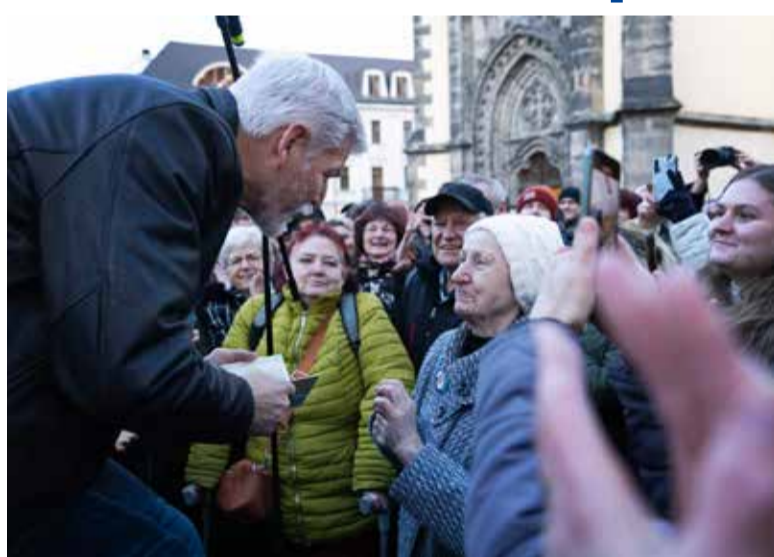
Kandidát na nového prezidenta České republiky oslovil všechny generace.

Velkým tématem obecně je bezpečnost. Zdravotní krize silně narušila náš pocit bezpečí a k ní se přidávají další často diskutované hrozby. Lidé vnímají, že se hovoří o hybridních hrozbách, mezi které spadá i zneužívání nových technologií, s nimiž zatím nemáme mnoho zkušeností a děsí nás stejně jako cokoli, co neznáme. Velkým tématem je také roz-