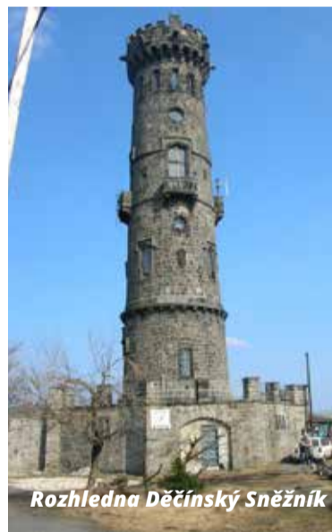
Rozhledna Děčínský Sněžník

25 m dlouhý bazén s tobogánem, rekreační bazén s 61 m dlouhým tobogánem, dětské brouzdaliště se skluzavkou, saunu, venkovní saunu i parní lázeň. Pro aktivní odpočinek lze zajít do fitness centra, či si zahrát squash.