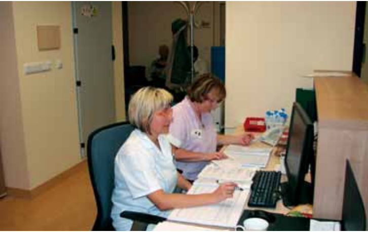
Každého klienta kardiocentra se nejprve ujme zdravotní sestra v recepci.

lu na jednotlivých odděleních. Letos došlo i na kardiologické oddělení, konkrétně jeho ambulantní část. Sektor D v pátém patře pavilonu interních obo- rů, v místech, kde dříve působila aryt- mologická poradna, plicní sálek a šatny zdravotních sester, prošel stavebními úpravami s nákladem přes 22,5 milio- nu korun, z nichž 15 milionů byla do- tace Libereckého kraje a zbytek hradila