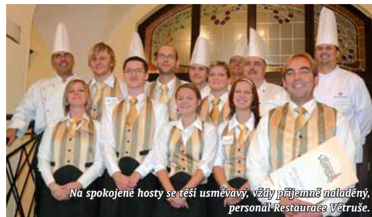
Na spokojené hosty se těší usměvavý, vždy příjemně naladěný, personál Restaurace Větruše.

Více na www.vetruse.cz , text a foto: Metropol