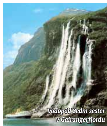
Vodopád Sedm sester v Gairangerfjordu

tem nebo přes Öresundský skandinávský most s čtyřproudou dálnicí či dvoukolejovou elektrifikovanou tratí. Na dánské straně se jede nejdříve téměř po půl kilometru dlouhém umělém poloostrově, na němž začíná tunelová část trasy dlouhá 3 510 metrů. Tunel se vynoří uprostřed průlivu Öresund na uměle nasypávané ostrově Papparholm o délce čtyř kilometrů, aby pokračoval nejmítelnější a nejatraktivnější částí, dvouúrovňovým mostem s celkovou délkou 7 845 metrů.