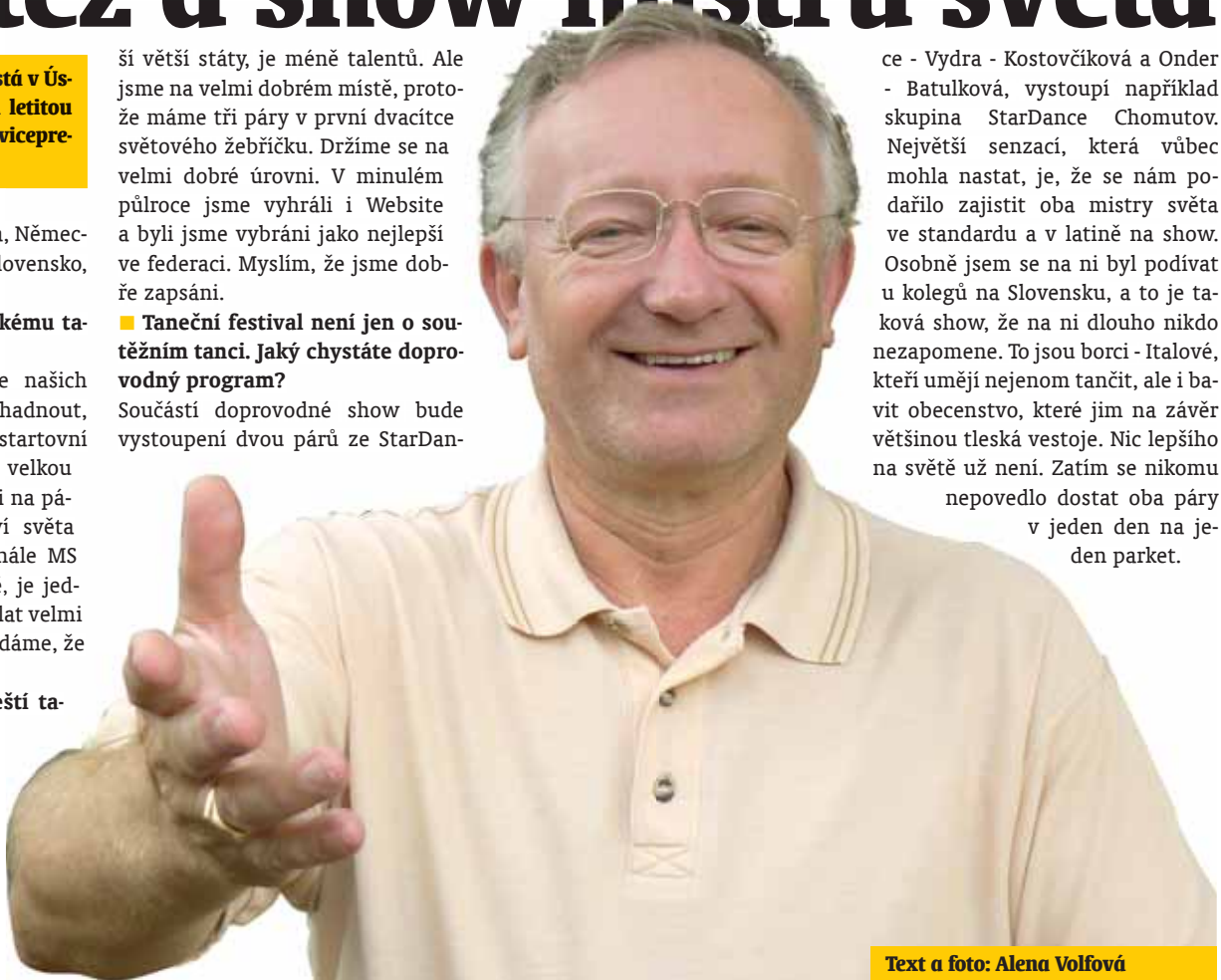
Text a foto: Alena Volfová

Součástí doprovodné show bude vystoupení dvou párů ze StarDan-