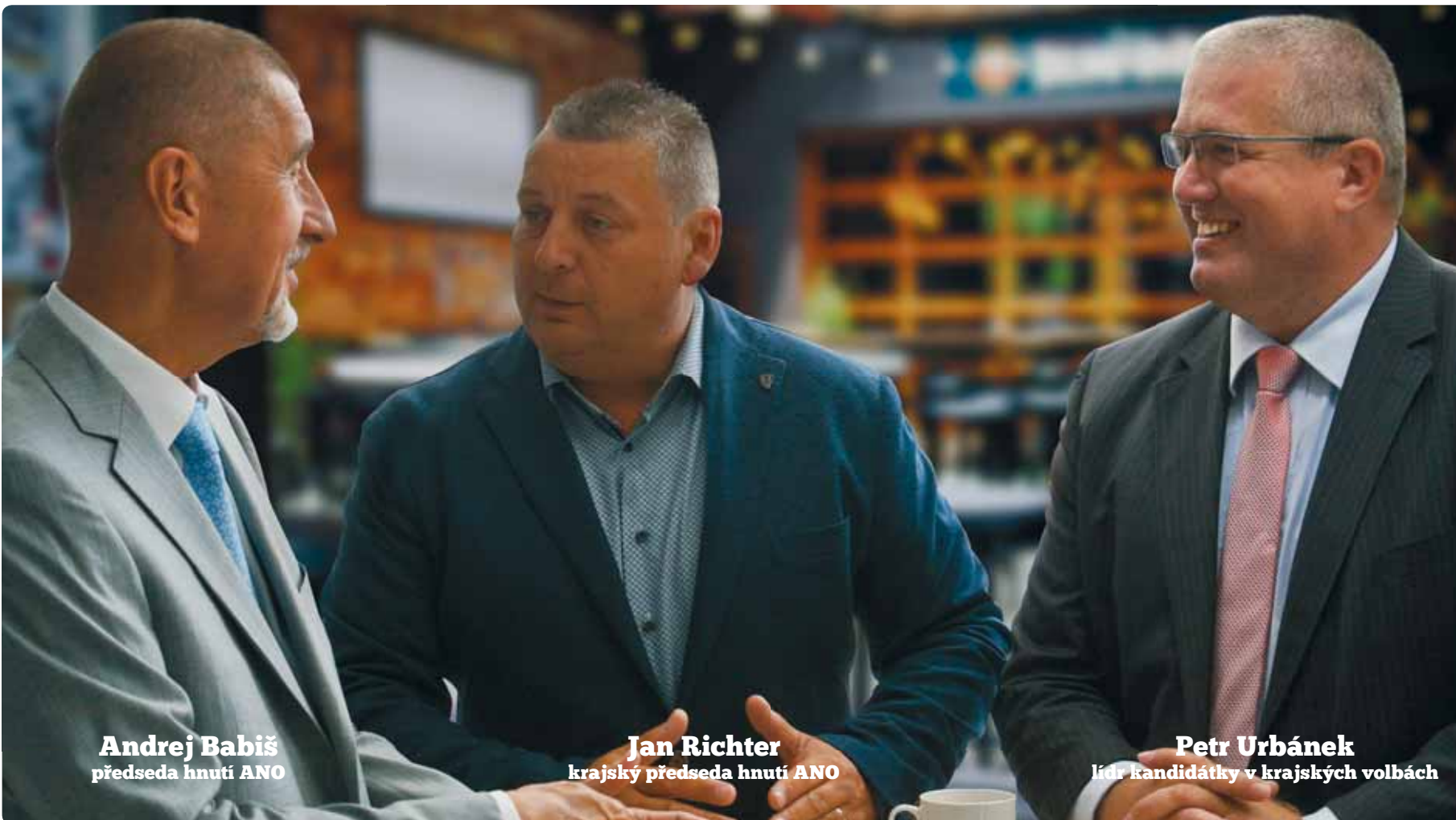
Andrej Babiš předseda hnutí ANO