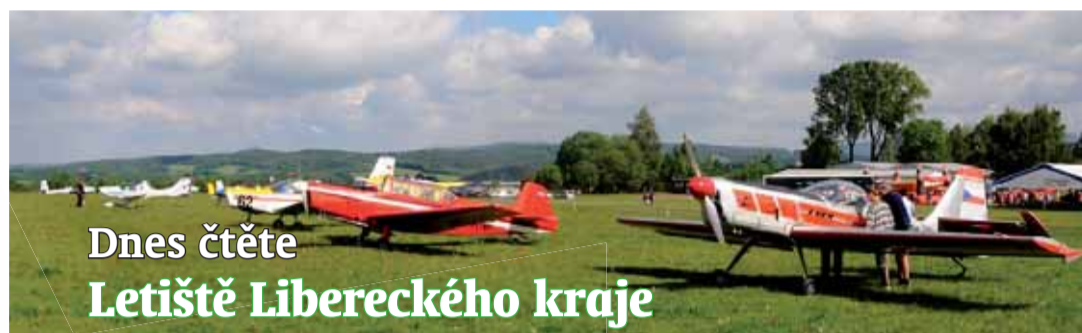
Dnes čtete Letiště Libereckého kraje