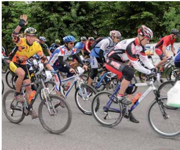
Na start devátého ročníku nastoupilo na devět set závodníků.

Kondoři odjžděli k druhému zápasu v sobotu 13. června. Hned od prvních minut střetnutí nenechali Kondoři nikoho na pochybách o extraligovém týmu pro příští sezonu. Desetibodový náskok po první čtvrtině do poločasu úměrně narostl na 21 a klid v hostujícím celku mohl zavládnout definitivně. Třetí dějství bylo ve znamení vyrovnanější hry, ovšem Severočeši neztratili ze svého náskoku pranic a mohli svůj výkon v závěru vyšperkovat navýšením konečného skóre. Nakonec Kondoři vyhráli o 30 bodů. (du)