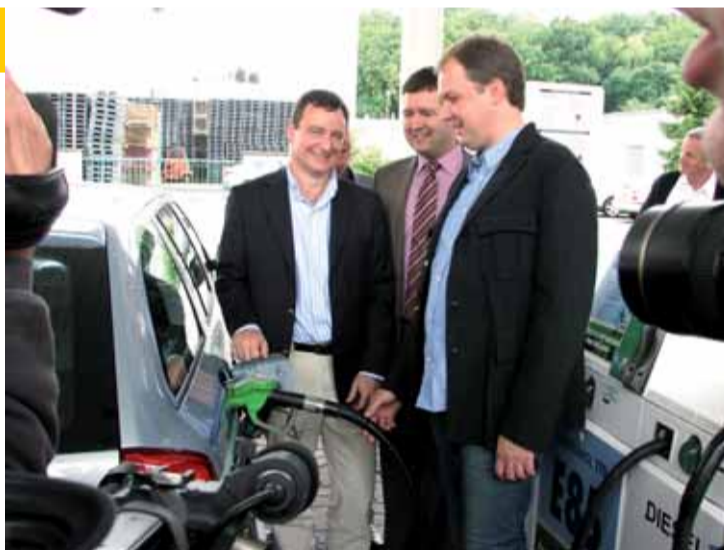
První natankování ekologického paliva E85 u čerpací stanice KM-PRONA v Mladé Boleslavi provedl symbolicky hejtmán Středočeského kraje David Rath.

„Mě osobně uvedení výroby ekologického paliva E85 nadchlo při loňské návštěvě Dobrovského cukrovaru a lihovaru a rozhodl jsem se, že tuto aktivitu, která spojuje zemědělství, zpracovatele a výrobce automobilů, musíme podpořit. Snažíme se tak na půdě Parlamentu i na našem úřadu. Byl bych moc rád, aby se informace o nových možnostech dostala k co nejširší veřejnosti, aby se zvýšil zájem o nové automobily a tím