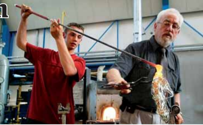
Sklářští výtvarníci letos využijí na sympoziu místo provozoven zkrachovalého Crystalexu i dílny a učebny Vyšší odborné školy sklářské a SOŠ v Novém Boru.