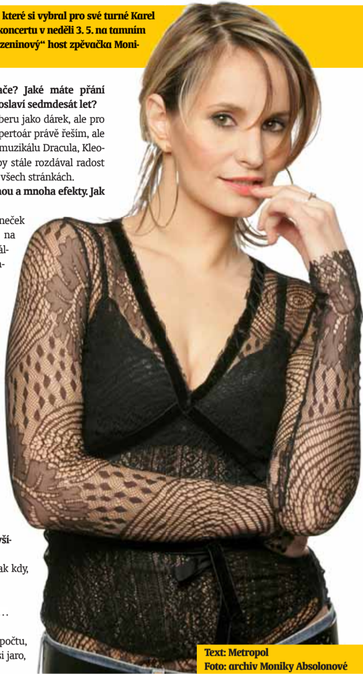
Text: Metropol

Moc se na vás těším! Přijďte v hojném počtu, bude to opravdu skvělá událost! Užijte si jaro, mějte se moc hezky a nedejte se!