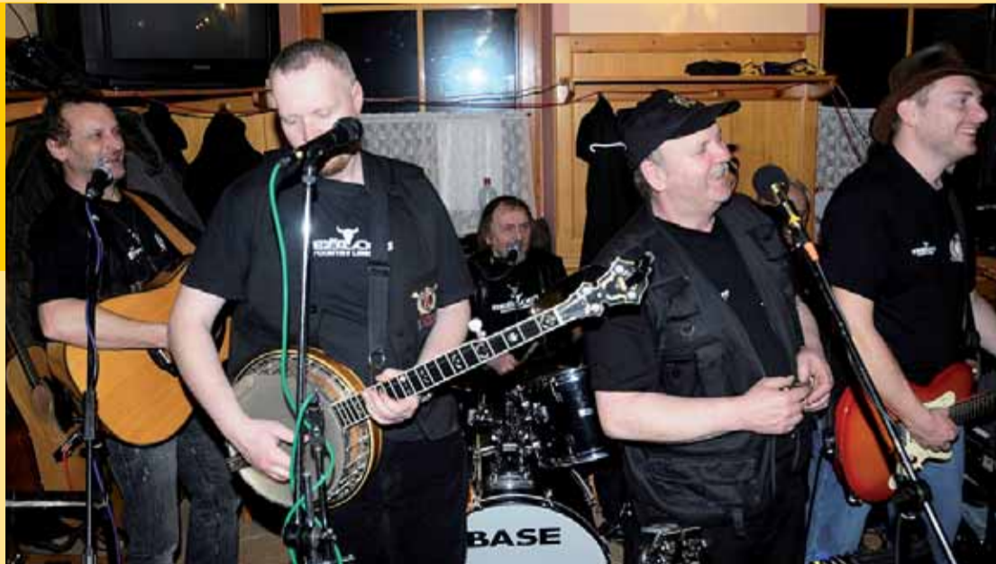
Na Countrybále hrála dvěma stovkám návštěvníků již po šesté liberecká country kapela Sešlost.