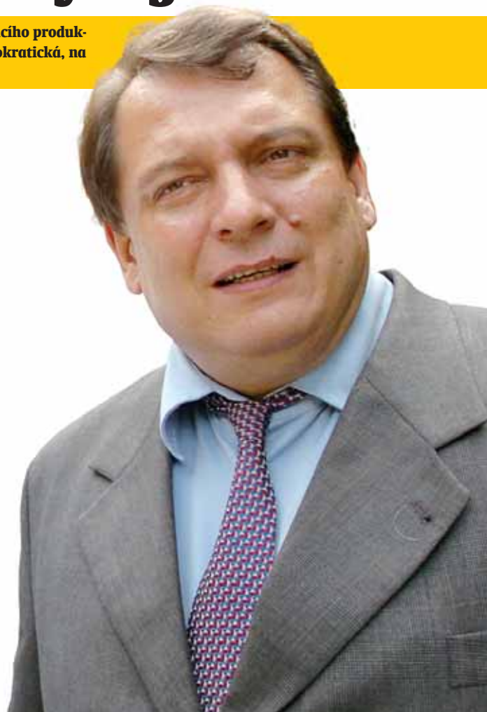
Text: Metropol

Navrhujeme také nově zavést možnost prodloužit pobírání podpory až na 9 měsíců pro ty, kdo se budou účastnit rekvalifikačních a vzdělávacích programů a současně v uplynulých třech letech odpracovali alespoň 24 měsíců. Dočasným opatřením může také být kromě jiného podpora automobilového průmyslu, kdy by podpora od státu činila 25 tisíc korun na nákup nového vozu při vyřazení starého auta nad deset let vlastněného alespoň dva roky. Sociální demokracie také klade důraz na ochranu zaměstnanců při platební neschopnosti podniku. Těch bodů je samozřejmě celá řada, konkrétní data jsou na specializovaných webových stránkách ČSSD www.protikrizi.cz či v brožuře, kterou rozdáváme občanům.