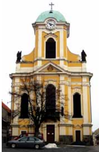
Barokní kostel sv. Petra a Pavla v Ústěku.