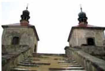
Kaple Nalezení a kaple Povýšení sv. Kříže.

Dominanty celé kalvárie, tři symetricky rozmístěné kaple, jsou viditelné téměř ze všech stran z velké dálky. Troufám si říct, že nejhezčí pohled je z náměstí v Ústěku, kdy panorama s kaplemi dokresluje i kostel sv. Petra a Pavla. Srdce barokního poutního místa začalo tepat na samém počátku 18. století, kdy byl položen jeho základní kámen. Místo nemůžeme minout. Z obce Ostré nás ke schodům zavedou prosté barokní a empírové kapličky. Odsud vstoupíme na prostornou terasu s klečícím Ježíšem Kristem a apoštoly. Sochy jsou však značně zdevastované. Ale i přesto se nám nabídne pěkný výhled do krajiny, který odjinud nevidíme.