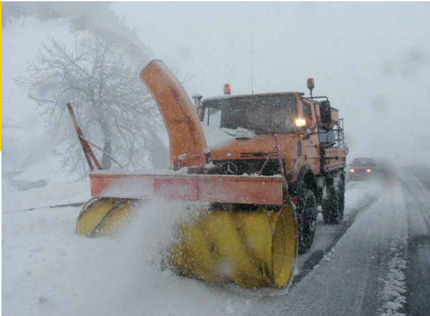
Jedna z 15 fréz, které má správa k dispozici, na nejhroženějších komunikacích Krušných hor, řízená Janem Muchou, ukrajuje pás téměř dvoumetrové závěje a rozšiřuje vozovku na vrcholu Cínovce.

Výhodou je, že správa má v dobrém stavu vozový park, jenž má věkový průměr 14 let. Když jsou peníze, starší technika se nahradí novou. V plánu pro příští období je získat čtyři nové sypače, automobil není těžké sehnat, na speciální nástavbu se však musí čekat i rok. „V současné době obhospodářujeme 118 sypačů s pluhem, v horských oblastech, kde se vytváří vysoké závěje a sněhové jazyky, maximálně využíváme 12 sněhových fréz, k zimní údržbě pak patří nakladače a 40 traktorových škrabek. Techniku řídí a obsluhuje v tomto období téměř nepřetržitě na 350 lidí. Někdy motory ani nevychladnou a okamžitě vyjíždějí znovu do terénu. Při hustém sněžení a sil-