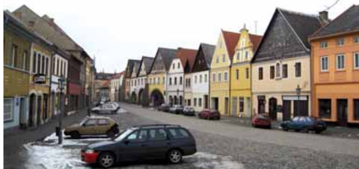
Historické jádro města kazí snad jen moderní technika.