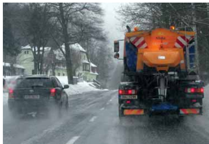
Mercedes s nástavbou pro posyp vozovky při cestě z Dubí na Cínovec prováděl chemickou údržbu a radlicí odhrnoval sníh za svodidla.