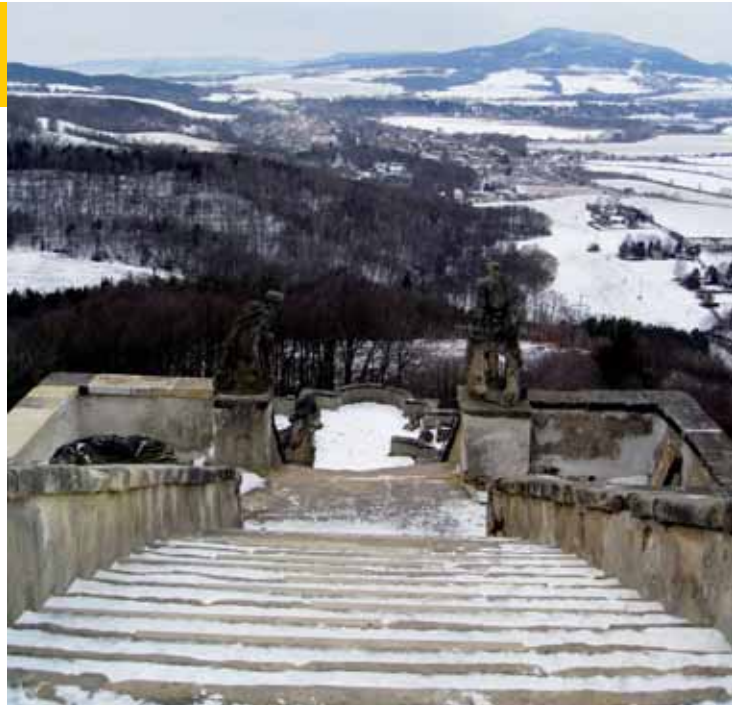
Pohled ze schodů od kaplí - okolní krajina jako na dlani.

O pár metrů dál nás čekalo další překvapení. Takzvané Ptačí domky. Jsou ukotvené ve skále a podepírají je ohromné trámy. Na druhé straně dole